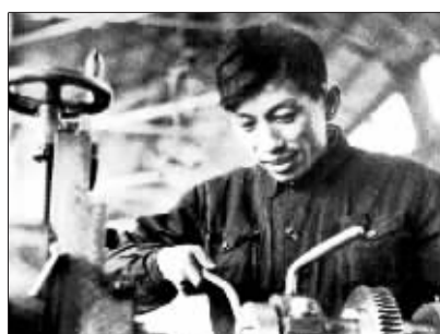
被誉为“走在时间前面的人”王崇伦