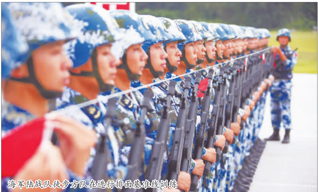
海军陆战队徒步方队在进行排面基准线训练

随着石家庄市“城镇面貌三年大变化”,城区建设日新月异,公交线路也经常改变,要想准确地为旅客指路,制作一份更加准确、方便的公交线路图成为当务之急。(下转第3版)