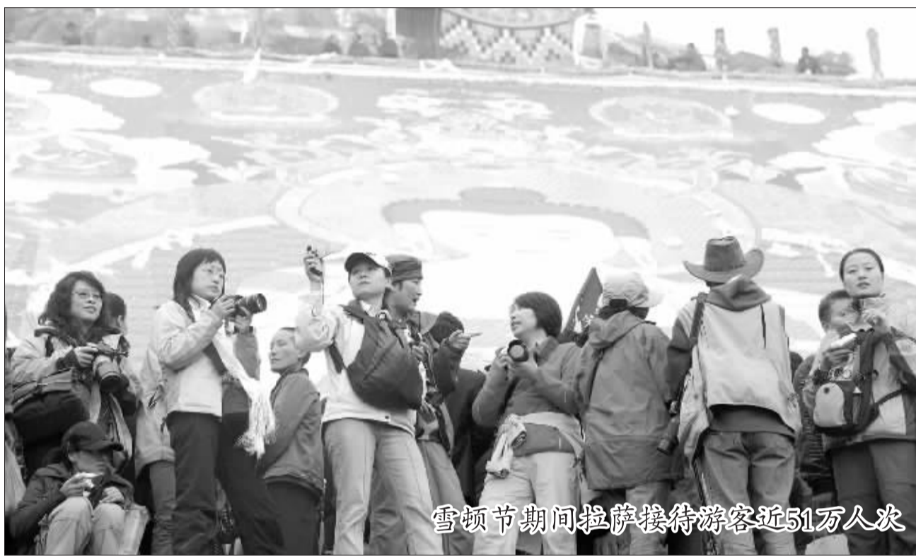
雪顿节期间拉萨接待游客近51万人次

新疆生产建设兵团司令员华士飞说,胡锦涛总书记此次亲临新疆考察工作,并在新疆维吾尔自治区干部大会上发表重要讲话,充分体现了党中央、国务院对新疆工作的高度重视和对全疆各族人民的巨大关怀,也更加坚定了兵团干部职工热爱祖国、无私奉献、艰苦创业、开拓进取的信念。在新的历史条件下,兵团既要当好生产队、战斗队,又要当好工作队、宣传队,更好地发挥推动改革发展、促进社会进步建设大军的作用,增进民族团结,确保社会稳定。