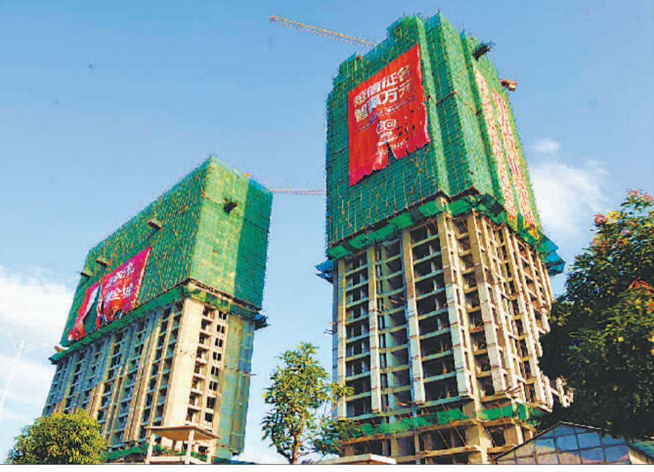
这是福州市一在建商品房楼盘(8月23日摄)。 据福建省住房和城乡建设厅统计,2009年1至7月,福建省完成房地产投资521.54亿元,同比下降17.3%,7月降幅比前6个月缩小2个百分点。其中省会福州市完成投资162.51亿元,同比下降12%。

新华社北京8月23日电 (记者欧阳迪娜) 据新华社全国农副产品和农资价格行情系统监测,与前一日报相比(下同),8月23日,食用油价格稳中有降;蔬菜、肉类、成品粮、鸡蛋、淡水鱼价格基本稳定。受旱情影响,吉林、内蒙古、湖南部分地区菜价上涨。 猪肉、猪肉、猪五花肉价格均持稳,分别为每斤10.20元和9.26元。近日,猪肉价格涨势略有放缓,但随着天气转凉、节日临近,消费需求将有所增加,预计猪肉价格的上涨走势短期内不会改变。 油菜、生菜、白萝卜、洋葱价格上涨,西红柿、茄子、青椒价格下降,涨幅均不超过1%;大白菜、芹菜、豆角、黄瓜、土豆价格持平。据吉林松原、内蒙古通辽信息集员反映,近期当地出现严重干旱,导致部分蔬菜减产,价格因货源短缺而上涨。此外,旱情对湖南张家界、常德等地菜价的影响也开始显现,菜集员反映部分蔬菜供应吃紧。23日,两地大白菜、生菜、青椒、西红柿、豆角等价格上涨一至两成。