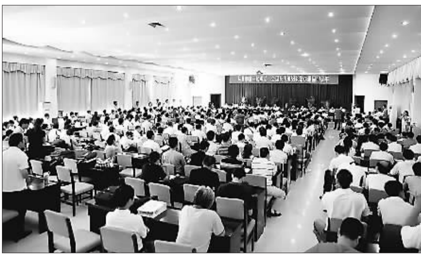
2008年,中宣部出版的新闻阅评曾以“小天地作出大文章——工人日报班组天地热情歌颂改革开放30年”为主题,专门表扬了“班组天地”专刊。

班组政治地位不断提高60年来,党和国家领导人始终关心关注班组建设,在视察企业时多次深入到班组与职工面对面谈心交流,尤其近几年,温家宝总理先后三次到井下与班