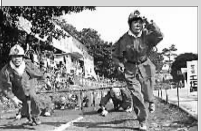
8月18日,重庆能源集团打通一矿400名班组长参加了矿里组织的“我爱我家”安全技能竞赛。该竞赛重在提升员工的综合素质、安全生产的协作能力及突发事件的应变能力。每支参赛队选派4名队员参加竞赛,模拟井下现场穿越工作面、穿戴自救器、灭火、负重空隔离墙、安全加油站等12个项目,以完成时间的多少计算成绩。让参赛者感触深刻的是,面对突发事件,不靠团队协作的力量,想化险为夷很难。

跟随共和国的脚步,河北冀中能金牛股份邢台矿也走过了41年,这期间,该矿的班组安全管理也走过了一条由粗到细的精细化管理之路