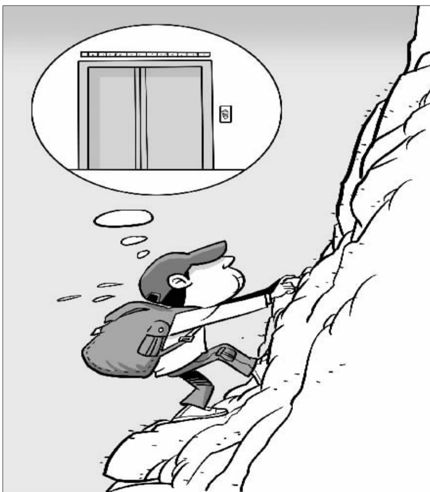
在向上行军中,不要总想着依赖别人,自己才是最靠得住的。

镰收割要把握好火候,做到恰如其分。割早了怕小麦粒重还不够,灌浆还没结束,影响产量。割晚了怕熟透,小麦焦了就要脱粒掉头,也会影响产量。更可怕的是割小麦赶上连阴雨,麦个子放在地里运不出来,时间稍微一长就要发芽,这是最要命的天气。所以,一般都是小麦熟到八成多就要开镰。一场南风,把家家户户的草帽都刮进了金色的海洋,农民们挥舞着镰刀,拉开一场惊心动魄的抢收序幕。割麦子既要有力气,更要有技巧,单是左手抓麦子,就能看出一个人割麦子的水平。不会抓的,抓不了多少麦棵手就满了,要放下再抓,来回跑不说,还要抓很多把才够捆一个麦个子。会抓的人将麦棵抓成扇形,上下镰交叉,几大把就能抓成一个麦个子。你看技术熟练的人割麦子,简直是在观赏道劲刚健的舞蹈动作,前腿弓,后腿蹬,弯腰摆步,一手抓麦棵,一手挥镰刀,嚓嚓嚓,一把一个,用麦棵作要子,随手一拧,麦个子有棱有角,俊俏而又扎实,一路割下去,麦个子像队列般整齐划一。割麦子可是个累死人的活,要早出晚归,说是趁凉快多出活;中午要加班,说是趁凉快