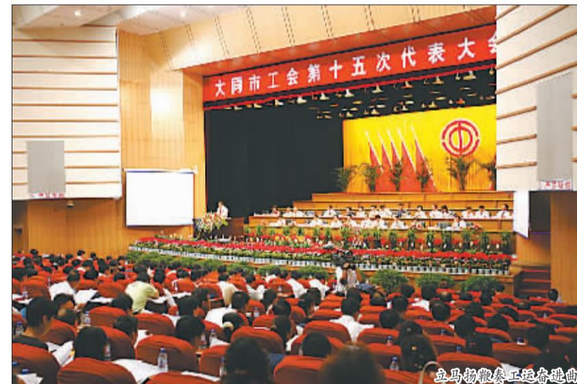
立马物搬泰工运奋建曲

职工、困难劳模共计25003人。市总还拿出50万元,为129名困难企业职工每人发放了3600元工资补贴,让坚持在一线送温暖的工会主席也感受到工会的温暖。