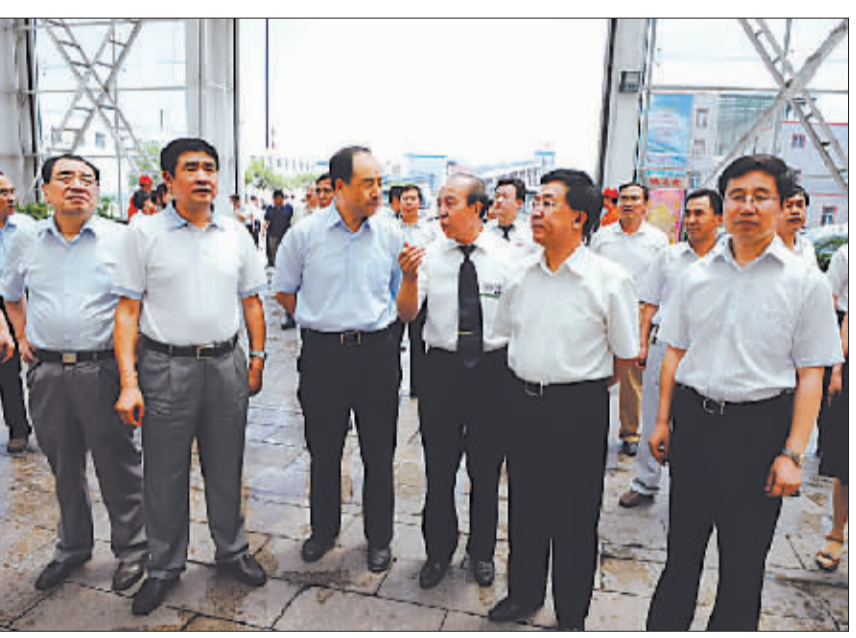
省、市领导深入大同调研