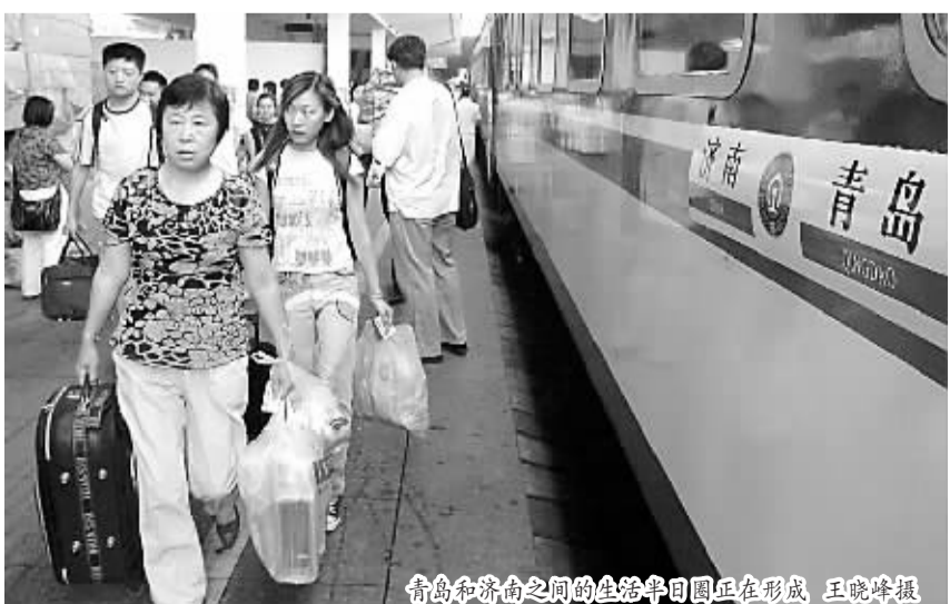
青岛和济南之间的竞争日趋激烈。

的113元调整为65元,3部现代客车票价由原来的84元调整为55元。青岛汽车北站沃尔沃客车票价调整为55元,现代客车票价调整为45元。豪华大巴降价42%,普通客车降价34%。记者从青岛交运集团了解到,这项暑期优惠活动将从7月10日开始,持续到9月30日,青岛交运集团和山东交运集团联手推出降价行动在山东历史上尚属首