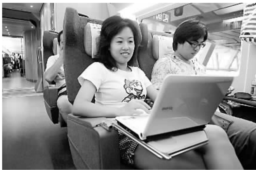
一名女士在京津城际列车上用笔记本电脑工作。

京津城际对旅游的“拉动效应”是非常明显的。天津市商务委的调查显示,自2008年8月1日京津城际高铁运营以来,天津市接待游客数量和游客旅游消费与去年同期分别增长13.3%和14.2%,为近10年来的最高水平。2008年外地到天津市旅游者消费总额超过750亿元,城际高铁对天津市2008年旅游增长的贡献率为35%。