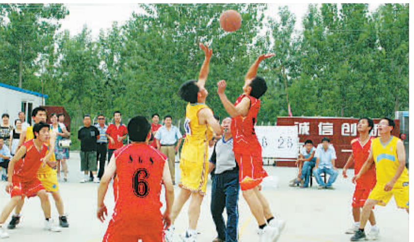
中铁一局“京沪杯”篮球赛结束 “中铁一局京沪高铁‘京沪杯’篮球大赛”日前落下帷幕。九工区、十工区和四工区分获前三名。中铁一局参赛京沪高铁的十四支篮球队参加了比赛。图为比赛现场。