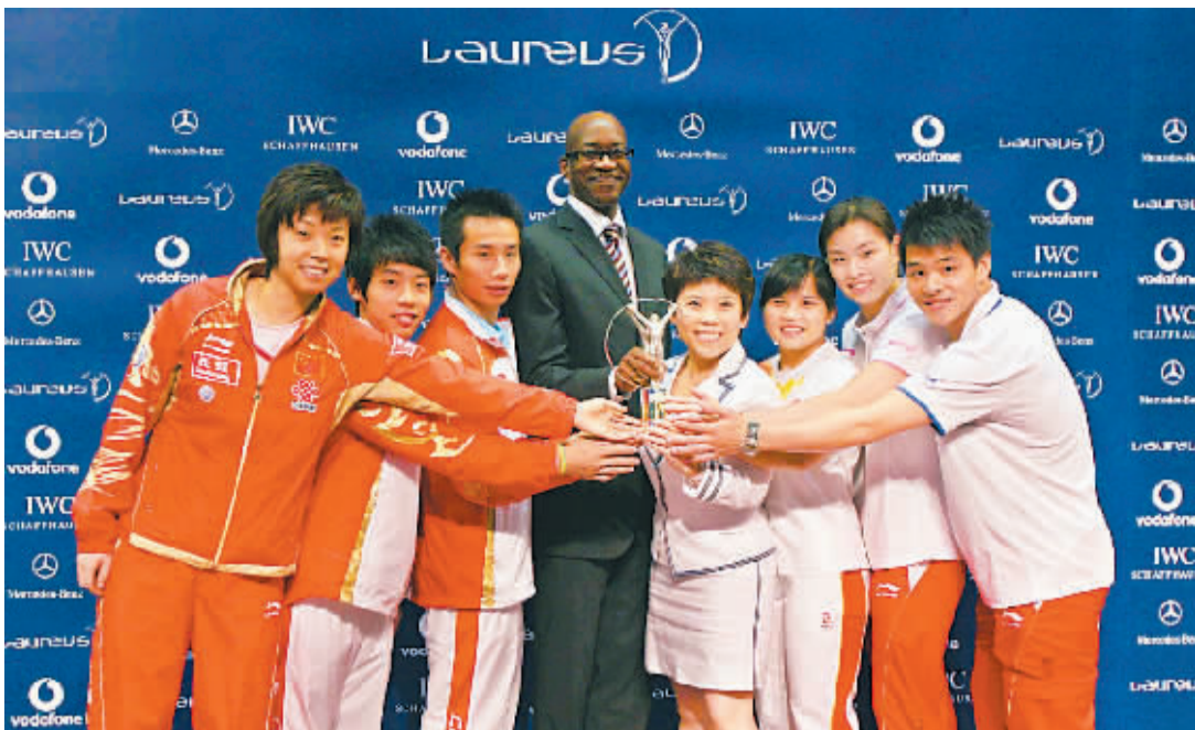
中国奥运代表团获劳伦斯最佳团队奖

传奇难续,神话易碎。对于已经不再年轻的中国“金花”来说,温网曾是她们梦开始的地方,但今天就连球迷似乎也能听到她们梦碎的声音。“单飞”终究没能拯救中国女网。中国网球要想在世界网坛拥有一席之地,恐怕还需要更多脚踏实地的工作。