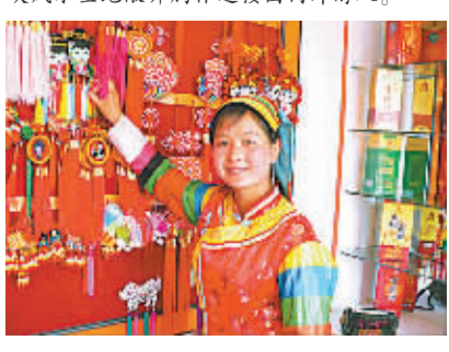
美丽的土族姑娘和手工艺品。

在“三江之源”、“歌舞之乡”和“佛教圣地”美誉的玉树藏族自治州,其自然和人文景观在国际上都具有一定的典型性和代表性。青海已将其境内探明的283处景区纳入生态旅游开发规划,形成以黄河源探奇、长江源探奇、澜沧江探奇等8个精品旅游板块,让这块风水宝地敞开心扉迎接国内外游人。