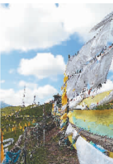
日月山口飘扬的经幡,传载着文成公主入藏、汉民族团结的故事。

经过多年的开发建设,青海在市场调研的基础上,本着“以游客为主,为游客服务”的原则,有效整合旅游资源,推出了“一圈三线十大精品之旅”——