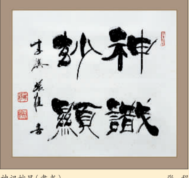
神识妙显(隶书) 张程