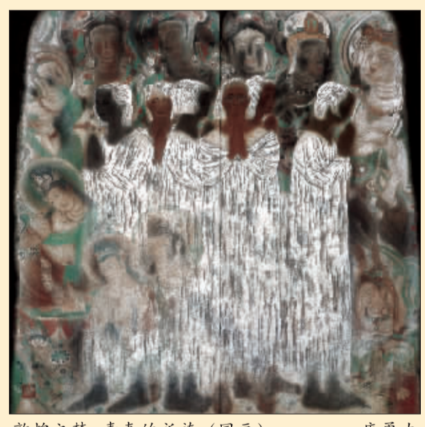
敦煌之梦-青春的祈祷 (国画) 唐勇力