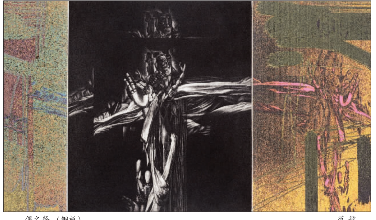
偶之祭 (铜版) 范敏 彝家姑娘 (国画) 罗苍诗