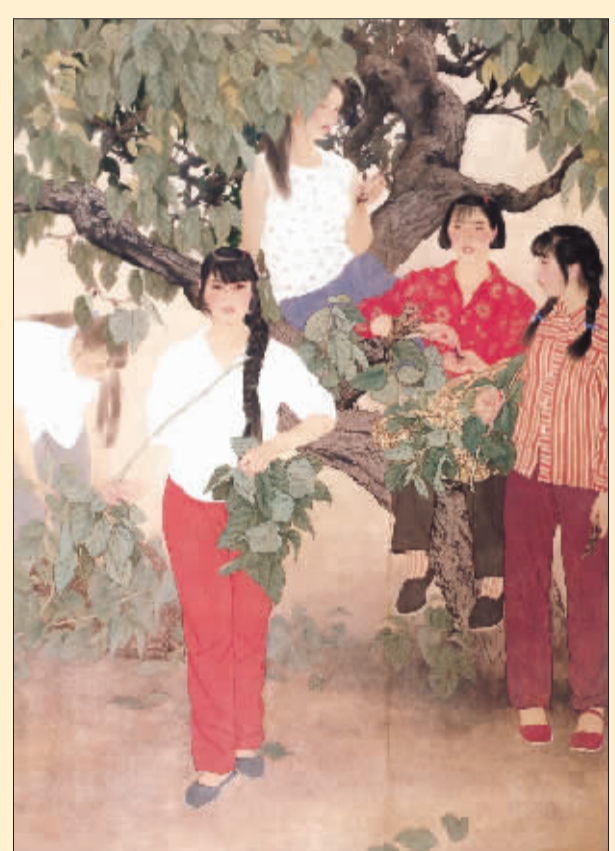
朝·露·桑 (国画) 何家英

2010，请把目光投向金秋的北京！投向第四届北京双年展！共建精神家园！共建绿色世界！