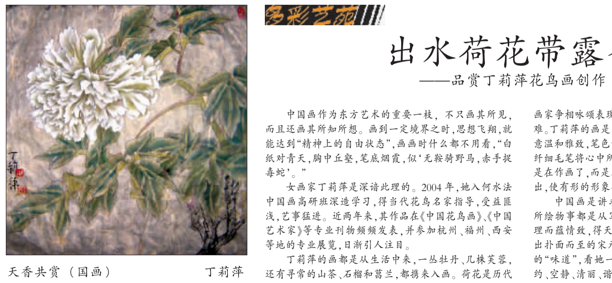
花香共赏 (国画) 丁莉萍

这是一组寻采自黄河古道的天然奇石，在2007年“走进奥运”全国奇石选拔赛上获得金奖，并为《收藏》杂志刊载。收藏者是热爱艺术奇石的宁夏中卫市总工会主席马建兴。