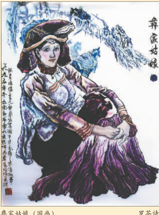
彝家姑娘 (国画) 罗苍诗