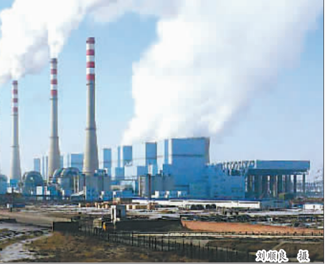
最新的国家电网公司调度中心统计数据显示,今年6月上旬,全国日均发电量同比下降0.2%,与5月日均发电量下降3.54%相比,降幅大幅收窄。由此可见,国内发电量的回暖迹象愈来愈明显。

水平,公司以优质可靠的电力供应服务于自治区经济发展大局,作出了突出贡献,但企业自身却无法通过正常经营积累电网建设资金,电网投资能力严重不足。