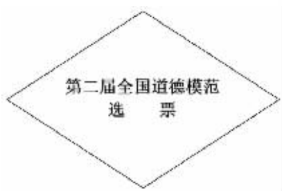
附：全国道德模范评选投票信封标识