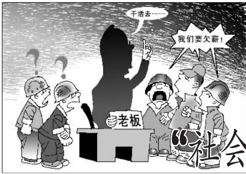
“欠薪老板”只见影子不见人 李法明 绘

目前,许多猎头公司掌握了人才的信息,企业需要什么人才,可以求助于这些公司给自己挖掘到需要的管理或技术人才,但要实现自己的用人愿望,就必须付出更加昂贵的代价。从企业长远发展的角度来看,具有培养人才的能力比起从其他企业去“挖”人才更为