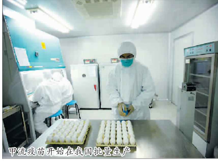
甲流疫苗开始在我国批量生产

地同时表示,由于甲型H1N1流感病毒是一种新型病毒,疫苗缺乏人群大规模使用的临床数据。国家食品药品监督管理局将组织协调各相关部门,对甲型H1N1流感疫苗的研发、生产、检验、流通、使用等环节进行全程监管,密切监测疫苗的安全性和有效性。 6月8日,科研人员在进行毒株种子批的制备工作。 当日,来自美国的甲型H1N1流感疫苗生产用毒株NYMCX-179A,从美国运抵北京,已经完成疫苗临床研究工作的北京科兴公司当晚启动了毒株种子批的制备工作,这标志着甲型H1N1流感疫苗的批量生产正式启动,并有望于7月底生产出首批疫苗。