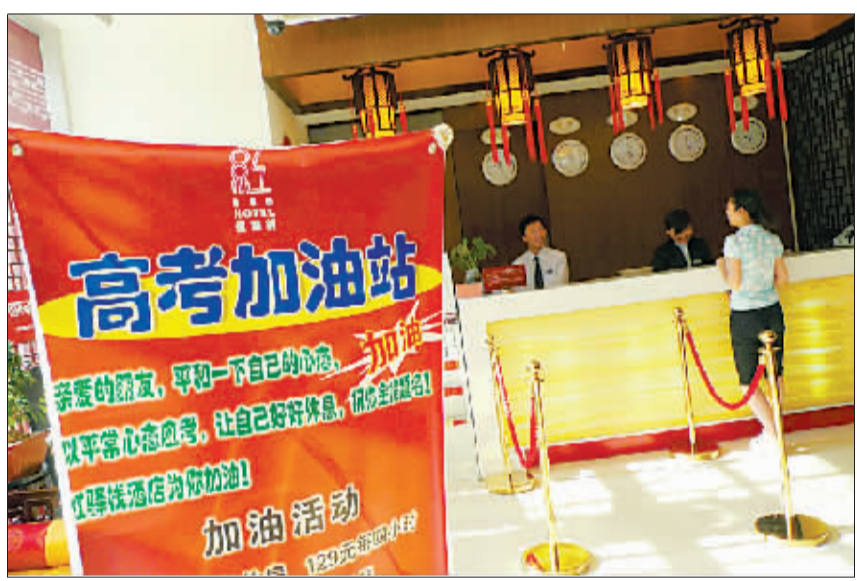
6月2日,北京设有高考房的红驿栈酒店大堂。

记者调查发现,今年高考房价格较往年有所下降,原因在于受金融危机和流感疫情的限制,人们的热情相对有所减少,为此,酒店不惜降价促销来抢抓商机。