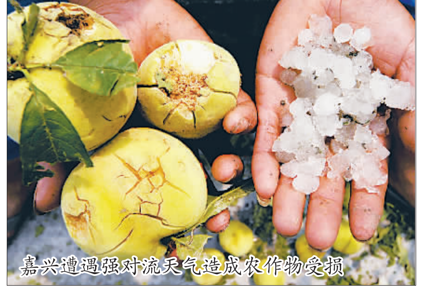
嘉兴遭遇强对流天气造成农作物受损

6月5日16时40分许,浙江嘉兴遭遇强对流天气,长达30多分钟的电雹造成该市南湖区凤桥镇、余新镇等地农作物受损。