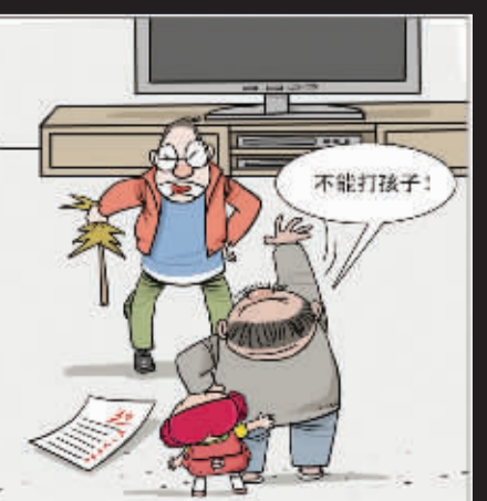
我小时您怎么不这样说我!