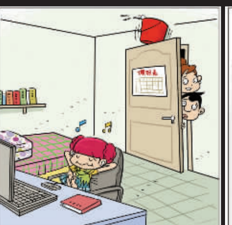
让我看看咱闺女干吗呢!