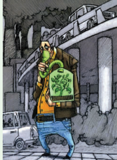
便携式绿色“氧吧” 法格尼亚(意大利)

城市污染,烟尘肆虐,只好随身带上一瓶绿色植物,这样就随时可以吸上几口新鲜氧气,享受一下“氧吧”的快感了。