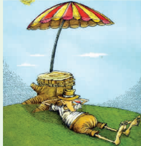
背靠“大树”好乘凉 索非(伊朗)

城市污染,烟尘肆虐,只好随身带上一瓶绿色植物,这样就随时可以吸上几口新鲜氧气,享受一下“氧吧”的快感了。