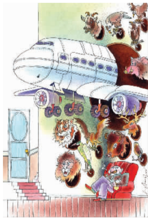
超级猎物——只是一幅漫画 米海罗夫(保加利亚)

这就是米海罗夫,他以幽默刺于幽默的手法 and 过人的大气,把泪与笑,灾难与调侃有机地编织在了一个让人回味无穷的画面里。