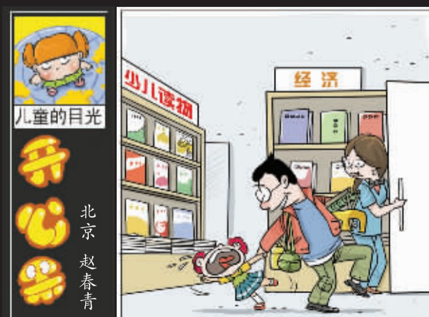
人家下班了,明天咱们再早一点来!