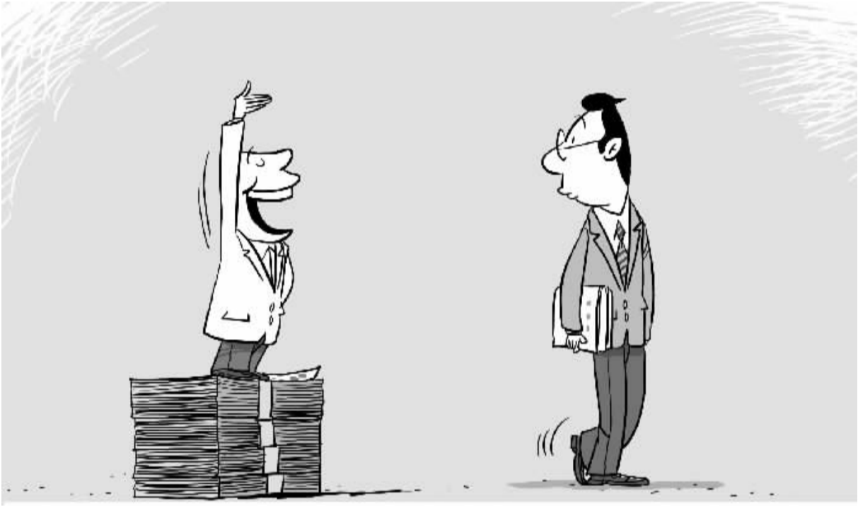
自卑有多种,程度最深的一种是:吹嘘自己干什么都是天才。

其实,无论是对号称“语林啄木鸟”的《咬文嚼字》挑剔,还是对作为普通老百姓的“啄木鸟”的挑错,都应该诚心感谢。诚如易中天在《咬文嚼字》2008年度合订本序中说的那样,错误也有种种,有可以避免的,有无法避免的。但不管什么情况,错了就是错了。“咱的书出了错,给读者带来了不便,甚至有误人子弟之虞,该不该道歉?我看该。其实,向读者道歉,对咱们自己,也是有好处的。什么好处?提醒。”正因为挑错对作者是一种提醒,所以作者应该