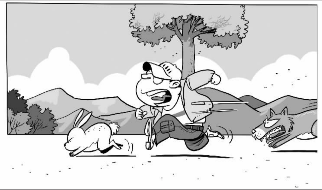
所谓失望,就是你苦苦等候的兔子来了,后面却还跟着狼!