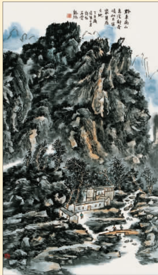
黔东南 (国画) 龙瑞