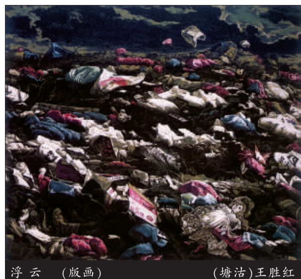
浮云 (版画) (塘沽)王胜红