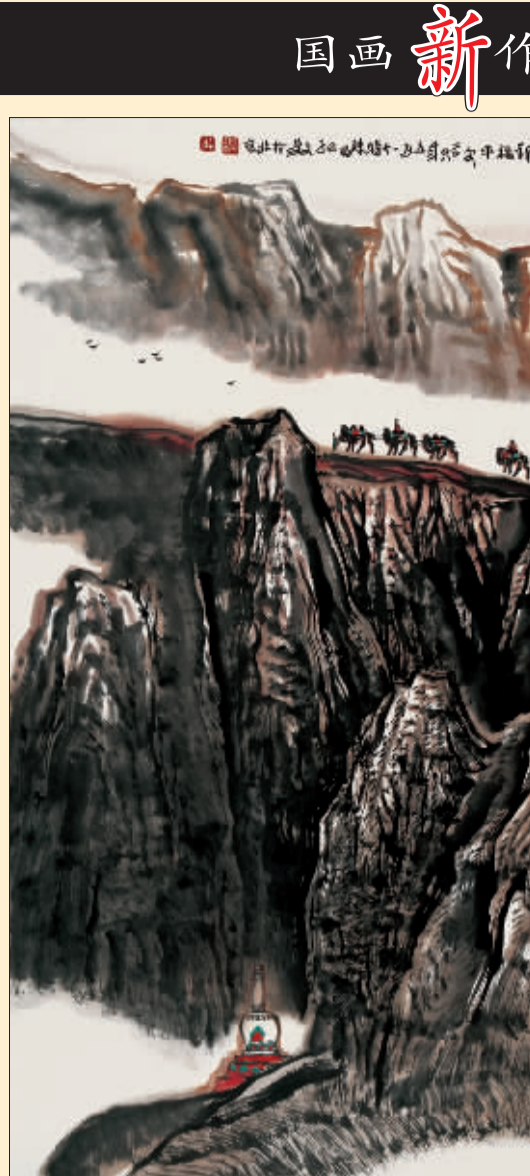
祈福平安 (国画) 王文芳