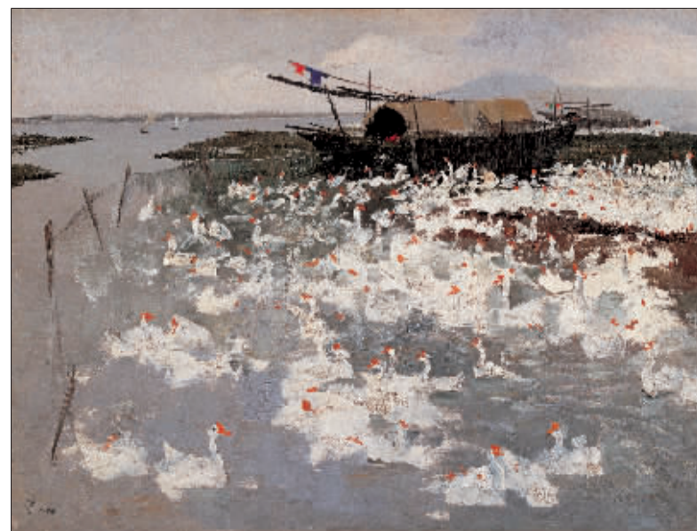
太湖鹅群 (油画) 吴冠中