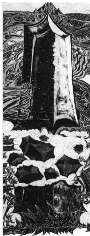
神州利剑 (版画)(重庆)戴政生