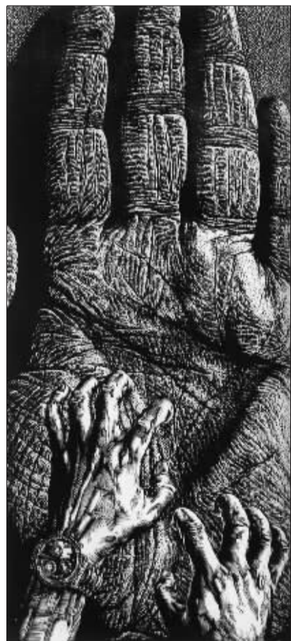
越 (版画) (鸡西)全胜