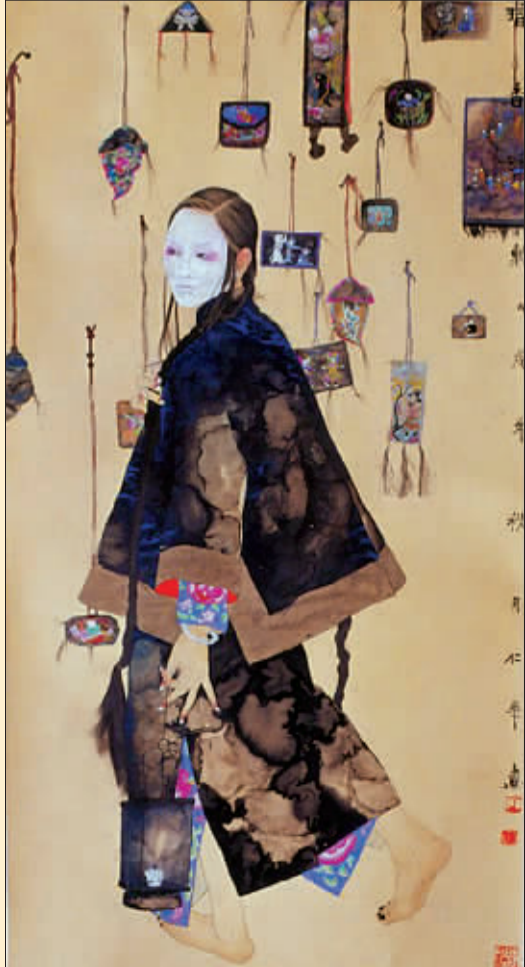
暗香浮动 (国画人物) 王仁华