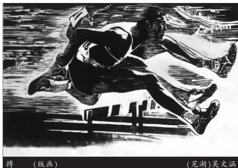
搏 (版画) (芜湖)吴文涵