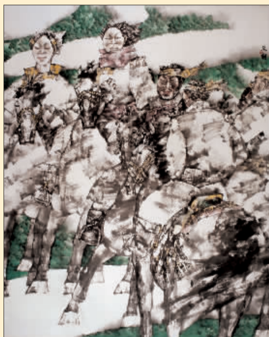
绿风 (国画) 张道兴