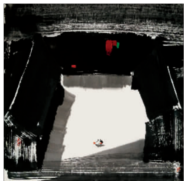
四合院 (水墨设色) 吴冠中