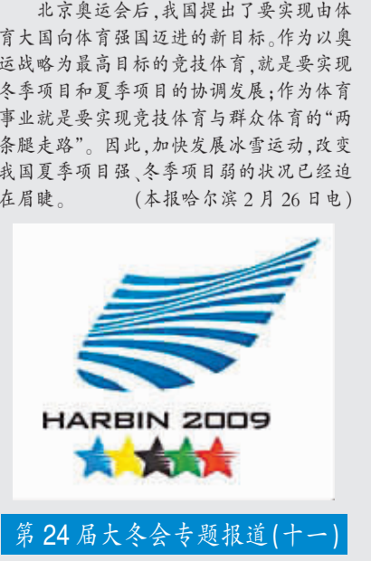
第24届大冬会专题报道(十一)

北京奥运会后,我国提出了要实现由体育大国向体育强国迈进的新目标。作为以奥运战略为最高目标的竞技体育,就是要实现冬季项目和夏季项目的协调发展;作为体育事业就是要实现竞技体育与群众体育的“两条腿走路”。因此,加快发展冰雪运动,改变我国夏季项目强、冬季项目弱的状况已经迫在眉睫。(本报哈尔滨2月26日电)