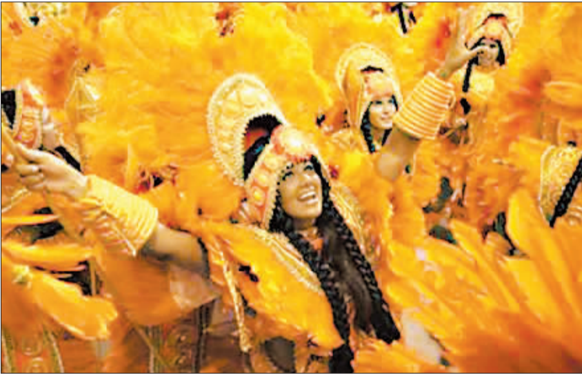
里约狂欢节24日落下了帷幕。尽管金融危机蔓延全球,但今年的里约狂欢节仍吸引了世界各地71.9万游客。图为落幕之夜,各种肤色的人们在街头身着彩装,载歌载舞,将里约热内卢变成欢乐的海洋。

新华社华盛顿2月25日电 美国国务院25日正式向美国国会提交了《2008年国际人权报告》。像往年一样,这份报告以道听途说的报道甚至谣言为依据,以人权问题为借口,对包括中国在内的许多国家进行毫无根据的指責,粗暴干涉他国内政。 这份报告中的涉华部分不顾中国人权取得的历史性进步,继续歪曲事实,无端攻击中国人权状况,对中国民族、宗教和司法制度等说三道四。 除了中国之外,该报告还对俄罗斯、巴基斯坦、朝鲜、古巴、伊朗、索马里、津巴布韦等许多国家的人权状况评头论足。 自1977年以来,美国国务院几乎每年都发表关于其他国家的所谓人权报告,借此干涉别国内政。 中国外交部副部长杨洁篪21日在北京与到访的美国国务卿希拉里·克林顿会谈后曾表示,虽然中美在“人权问题”上存在分歧,中方愿意在相互尊重、互不干涉内政前提下,与美方就人权问题展开积极对话,共同推动人权状况的发展。