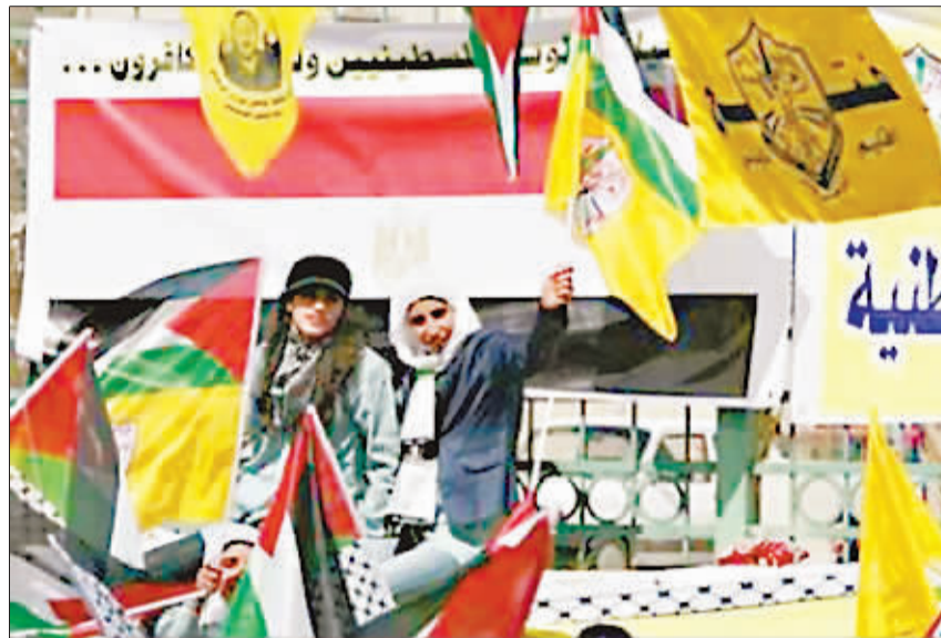
巴勒斯坦所有派别参加的巴内部和解对话26日在埃及首都开罗开始举行。图为当天在约旦河西岸城市纳布卢斯,当地民众举行集会欢迎和解对话举行。

面对韩国各界的不同评价,李明博25日表示虚心接受批评并听取各种不同意见,但也要坚持自己的原则,继续推进各项事业。当晚,李明博在总统府主持召开国务会议时说,过去的一年尽管政府竭尽全力,但还是未能避免犯错误,今后不能再犯同样的错误。他还表示,政府的目标是使韩国在世界各国中率先走出经济困境,向发达国家靠拢。