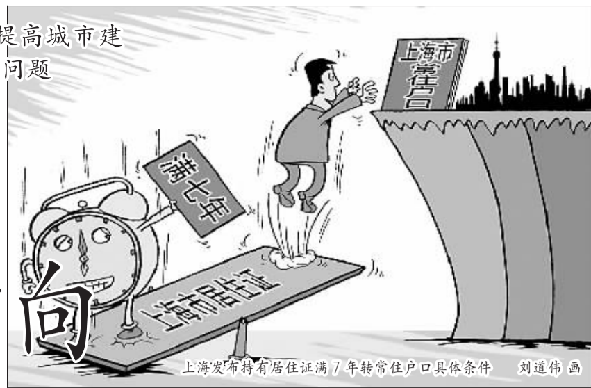
上海发布持有居住证满7年转常住户口具体条件 刘道伟画

建国以来,中国户籍管理制度的变化大致可划分为三个阶段:第一阶段,1958年以前,属自由迁徙期;第二阶段,1958年~1978年,为严格控制期;第三阶段,1978年以后,半开放期。1958年以前,人们可以自由迁徙。1958年1月,颁布了《中华人民共和国户口登记条例》,它包括常住、暂住、出生、死亡、迁出、迁入、变更等7项户口登记制度。该条例以法律形式严格限制农民进入城市,限制城市间人口流动,在城市与农村之间构筑了一道高墙,城乡分离的“二元经济模式”因此而生。