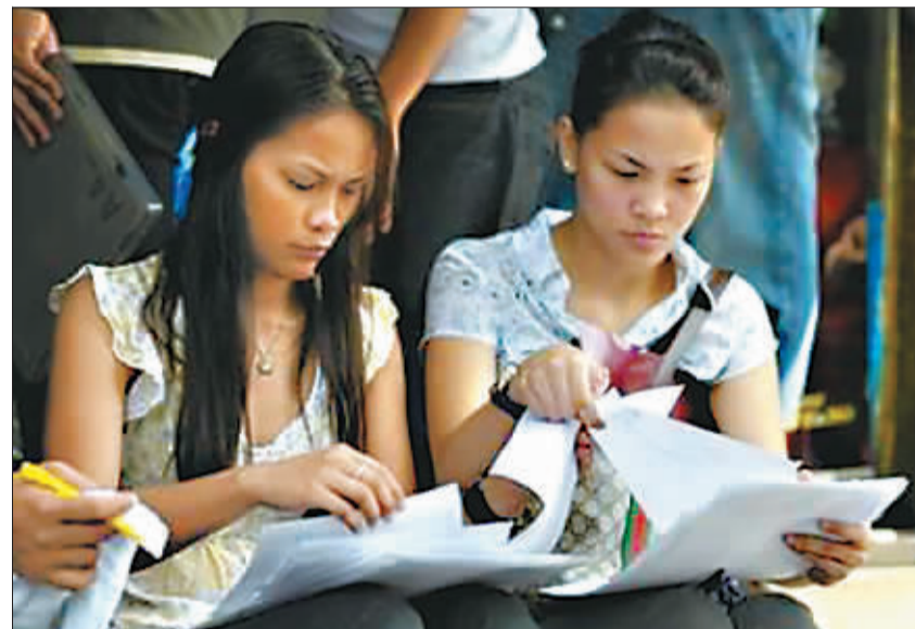
随着全球经济危机的不断加深，自今年10月以来，已经有至少近4万菲律宾劳动者失业。图为在首都马尼拉一家职业介绍所里，几名求职者正在准备个人简历。

对此，有反对者认为，在其他行业急需救助的时候，给电影业补贴属于钱没有花在刀刃上。从目前来看，美国电影市场受经济危机影响不大。美国电影业能否在这次经济衰退中实现新的发展，为刺激经济、拉动内需做出贡献，人们还要拭目以待。