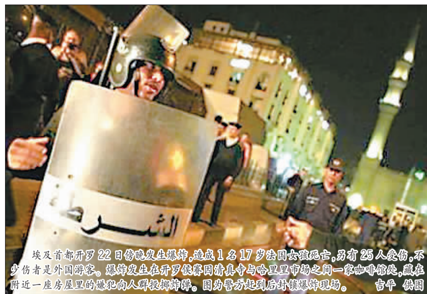
埃及首都开罗22日傍晚发生爆炸，造成1名17岁法国女孩死亡，另有25人受伤，不少伤者是外国游客。爆炸发生在开罗伊斯兰清真寺与哈利里市场之间一家咖啡馆处，藏在附近一座房屋里的嫌犯向人群投掷炸弹。图为警方赶到后封锁爆炸现场。

根据以色列法律，内塔尼亚胡最长将有42天的时间来完成其组阁任务。可以肯定，他在这段时间内会为组建广泛执政联盟而加紧努力。以色列电台政治评论员当天分析说，为了争取前进党、工党的加盟，内塔尼亚胡放此向前向一些右翼小党作出的承诺并非没有可能。可以预见，未来的一段时间，以色列政坛各政党围绕组阁问题而展开的利益斗争还会继续。