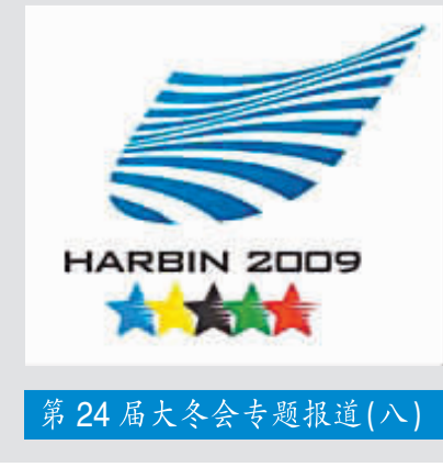
第24届大冬会专题报道(八)

罗格还表示，除了商业赞助和票务收入之外，政府的补助一直是很多民间运动的生命线。但在经济危机之下，政府更多地会选择把钱用在“更重要、更紧急”的事务上。这一点无疑会让困难重重的“草根体育”雪上加霜。