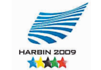
第24届大冬会专题报道(七)

一路上和“的姐”唠嗑，不知不觉就到了目的地。下车时，我才发现忘了问这位“的姐”的姓名。不过我知道这并不重要，我通过他们已经认识了美丽的哈尔滨和热情的哈尔滨人。(本报哈尔滨2月22日电)