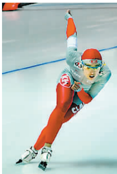
中国名将于静在比赛中。