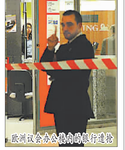
欧洲议会办公楼内的银行遭抢

据新华社澳大利亚墨尔本2月13日电(记者张雅诗 江亚平)澳大利亚警方13日说,他们已拘捕一名涉嫌在维多利亚州山火中纵火的男子。 警方说,这名39岁的男子被指控纵火导致他人死亡等数项罪名。他13日在维多利亚州一个小镇被捕,目前已被移交至州府墨尔本。