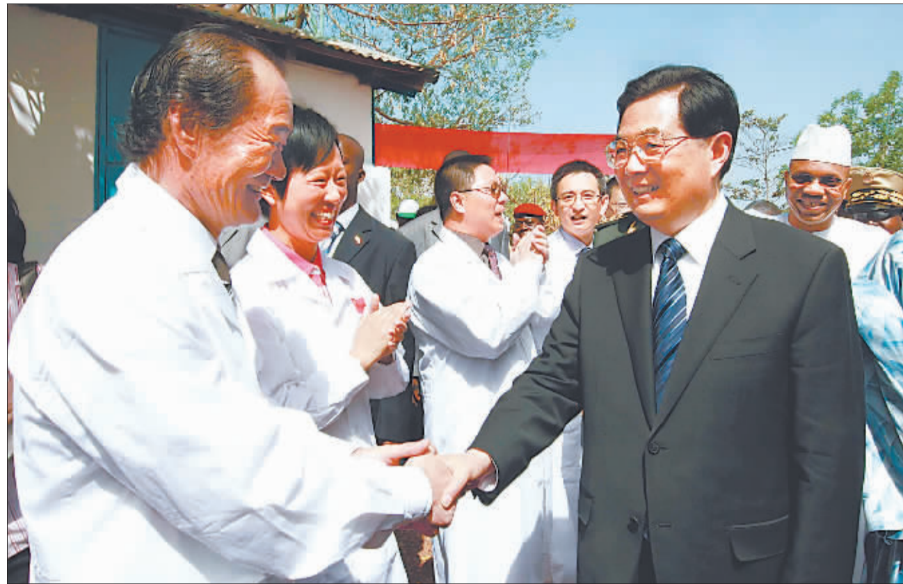
新华社记者 熊争艳 黄伟