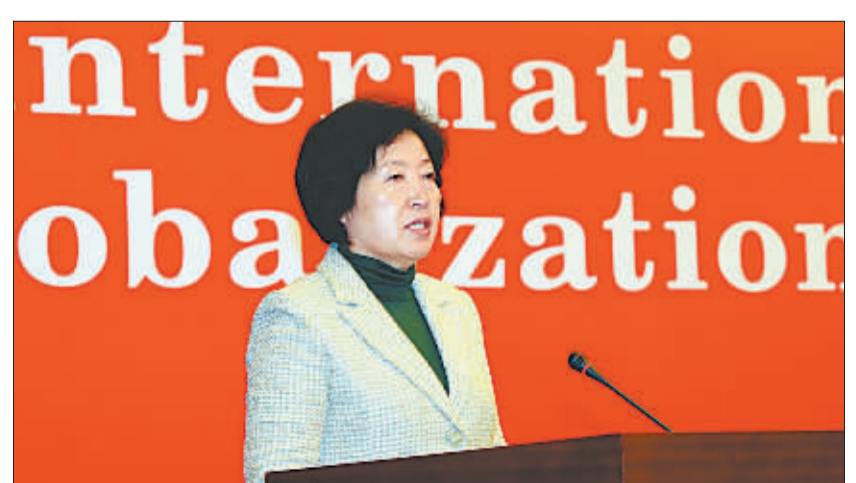
孙春兰作总结讲话。

尊敬的各位工会领导人，各位朋友，女士们、先生们： 大家好！“2009”经济全球化与工会”国际论坛今天就要闭幕了。两天来，大家围绕“科学发展、体面劳动、职工权益”这一主题进行了平等、坦诚、务实的研讨，取得了丰硕成果。论坛的成功举办，是各位工会领导人及所代表的工会组织高度重视、热情参与和共同努力的结果。两天来共有47名代表在研讨中做了正式发言，还有8名代表在自由讨论中发表了意见。在此，我代表中华全国总工会，向与会的各位工会领导人及你们所代表的工会组织表示衷心的感谢！ 中国党和国家领导人高度重视“科学发展、体面劳动、职工权益”问题。在“2008”经济全球化与工会”论坛开幕式上，中共中央总书记、国家主席胡锦涛强调，让各国劳动者在良好的生态环境中生产生活，是实现可持续发展的根本目的，也是各国广大劳动者实现体面劳动的重要前提。实现体面劳动，是以人为本的要求，是时代精神的体现，也是尊重和保障人权的重要内容，工会组织要履行维护劳动者权益的神圣职责。胡锦涛总书记的重要讲话对促进科学发展、实现体面劳动、维护职工权益、推动国际工会运动健康发展，产生了重大而深远的影响。当前，国际金融危机不断蔓延，给世界各国经济发展和广大职工利益的实现带来影响。如何应对