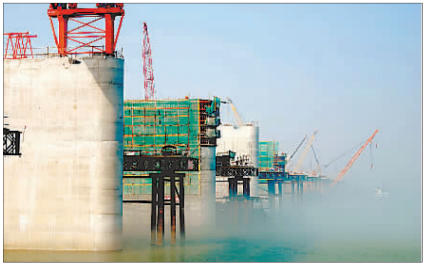
日前,中铁大桥局的工作人员正在东新赣江特大桥上吊装1500吨双导梁结构移动模架造桥机,标志着东新赣江特大桥即将开始进入造梁阶段。东新赣江特大桥是国家“十一五”重点工程——向莆铁路的控制性工程,同时也是全线最长的桥梁,施工难度大,技术含量高。该特大桥横跨赣江,全长27.3公里,总投资20.5亿元,目前已完成工程总量的40%,计划将于2010年6月完工。

本报讯(通讯员佟晓宾 黄传宝)宝钢冷轧硅钢在高牌号开发方面取得突破性进展。近日,50TW250、35TW230、35TW210三个牌号产品批量上市,得到了国内用户的认可。这标志着宝钢已率先突破了高牌号冷轧硅钢技术难题,成为国内迄今为止第一家可批量供货的企业。