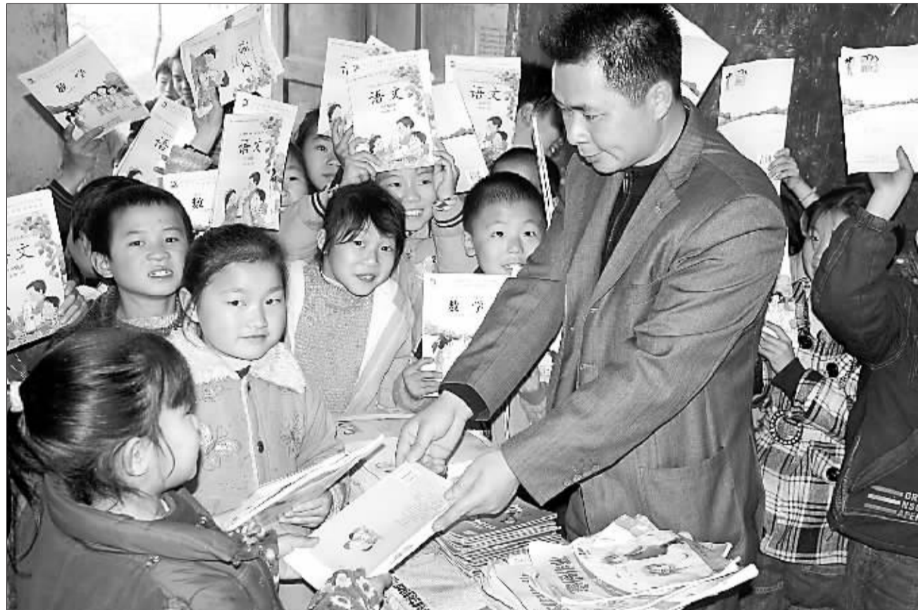
邵阳县若门小学农民工子女领到新书。

2月10日,湖南省邵阳县若门小学22名返乡农民工子女免费领到新书。当日,邵阳县中小学如期开学,近5000名随家长一起返乡滞留本地的农民工子女顺利办理转学接收手续,无需交纳入学费用。他们也享受义务教育阶段“两免一补”的政策。