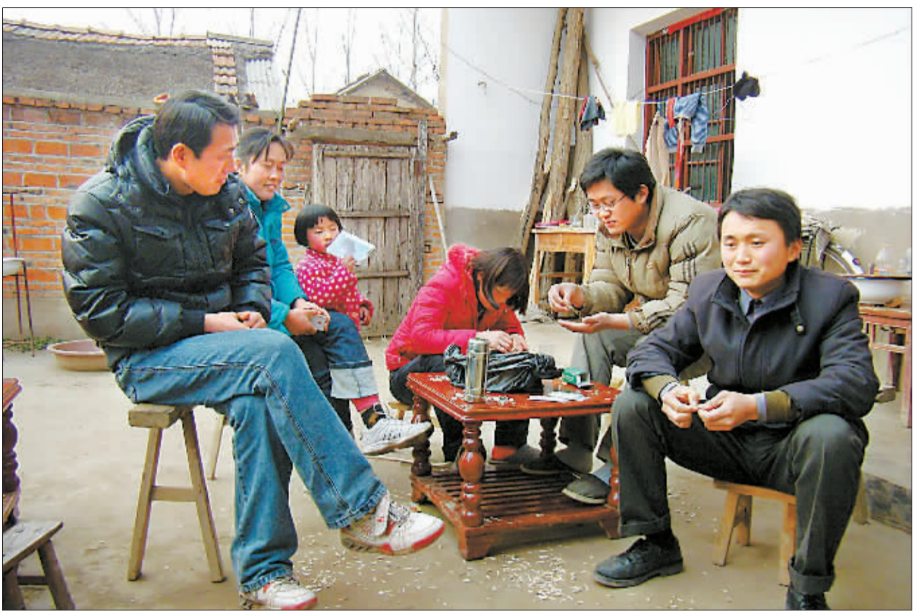
2月3日,农历正月初九,回到村子里的曾报一家人除了购买年货、走亲戚,大多数时