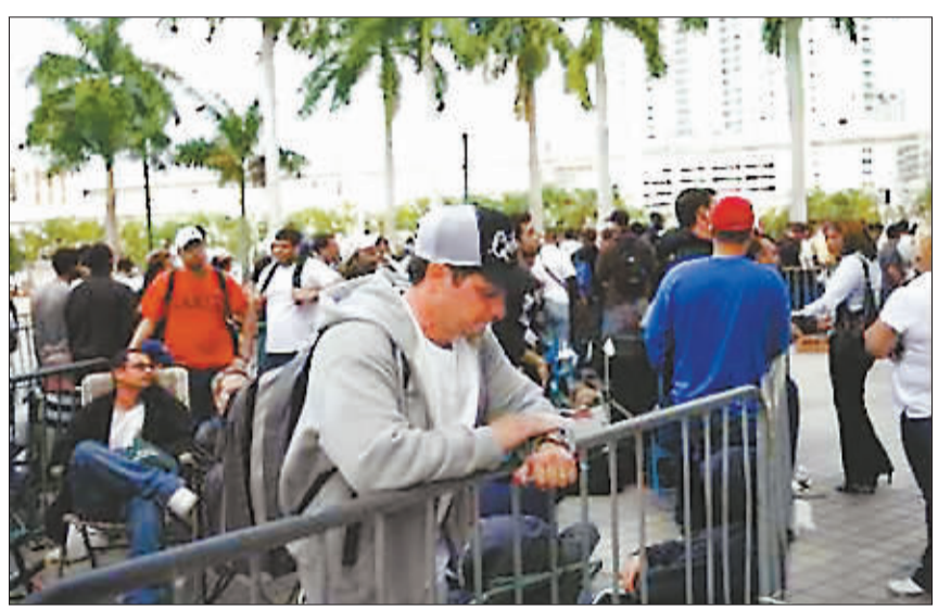
金融危机造成美国失业人数激增。图为2月2日在美国佛罗里达州城市迈阿密,上千名失业者正等着递交申请争取35个消防员岗位,招聘者宣布只接收前750份申请。

据报道,伊朗总统艾哈迈迪-内贾德通过电话发出了卫星发射命令。艾哈迈迪-内贾德随后发表讲话说,伊朗发射了第一颗自制卫星,希望这将是迈向正义与和平的一步。 2005年10月,俄罗斯将一颗为伊朗制造的卫星送入太空轨道。2007年2月,伊朗发射了第一枚运载研究材料的火箭。据伊朗媒体报道,2010年前,伊朗计划发射大约5颗卫星。