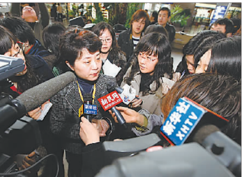
新华社“新华视点”记者 刘丹 杨金志