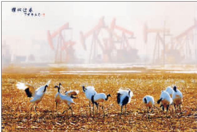
鹤鸣婉转戏逍遥,演绎和谐景正好。