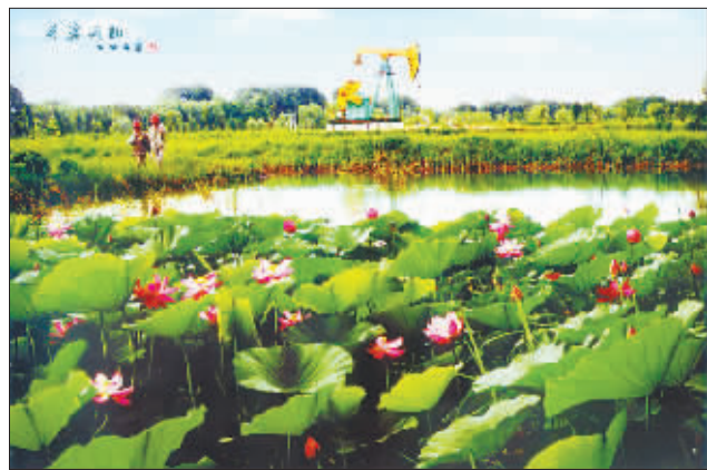
油城女人情婉柔,月宫嫦娥也自羞。玲珑心有凌云志,不着红妆更风流。