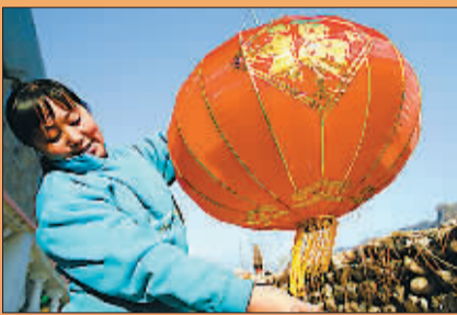
北京郊区灯笼第一村——红庙村,村民正在打理红灯笼。