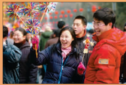
在北京地坛春节文化庙会上,除传统的饮食、游艺摊位外,还有舞龙、舞狮、盘鼓等民俗表演。