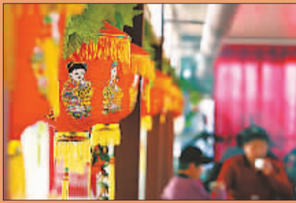
造型优美的灯笼为春节增添了喜庆的色彩。