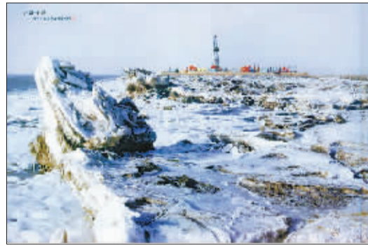
盘锦有中国最北端的海岸线,也是唯一结冰数百公里长的海域,被称为“中国北极”。这里的地下蕴藏着丰富的石油、天然气。

我喜爱摄影已有二十多年,已拍下数以万计的画。但近几年我才发现,最有魅力、最具特色、最能激发灵感、最值得拍摄的是辽河油田。我用色彩把辽河石油人在万顷滩涂中建成全国第三大油田的艰辛和豪迈,在钻塔、在万亩稻田上屹立的激昂旋律和在十多万亩芦苇荡里日夜不停运转的采油树所表现的傲然风姿定格。随着时间一年一年的过去,几百个节假日从未在家休息,无论风霜雨雪,严寒烈日,多少次在泥泞里艰难跋涉,多少次爬冰卧