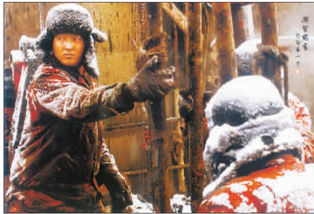
任凭风雪吹面凉,不理衣裳染白霜。莫问油人忙何事?胸中自有情义长。