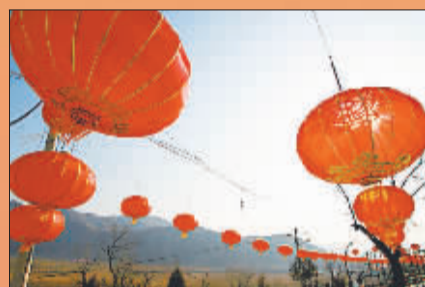
火红的灯笼展现出老百姓红火的日子。