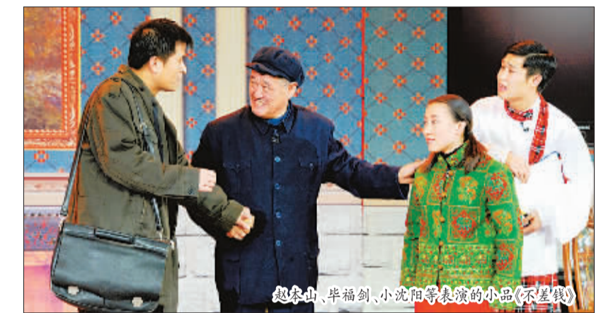
赵本山、毕福剑、小沈阳等表演小品《不差钱》