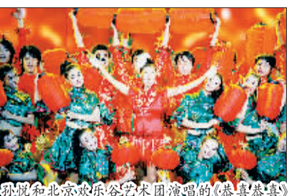
倪妮和北京欢乐谷艺术团演唱的《恭喜恭喜》

1月21日,一年一度备受关注的央视春晚终于掀开“红盖头”。总导演郎昆称,历时4个月准备的春晚节目排序虽然还在微调中,但大致已基本确定。除夕晚8点在央视1套、4套、9套、西语频道、法语频道、央视网并机现场直播,目前主持人确定为朱军、董卿、周涛、张泽群、柳群、鲁健。