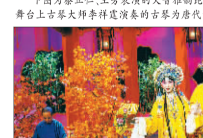
蔡正仁、王芳表演的大音雅韵昆曲《长生殿》