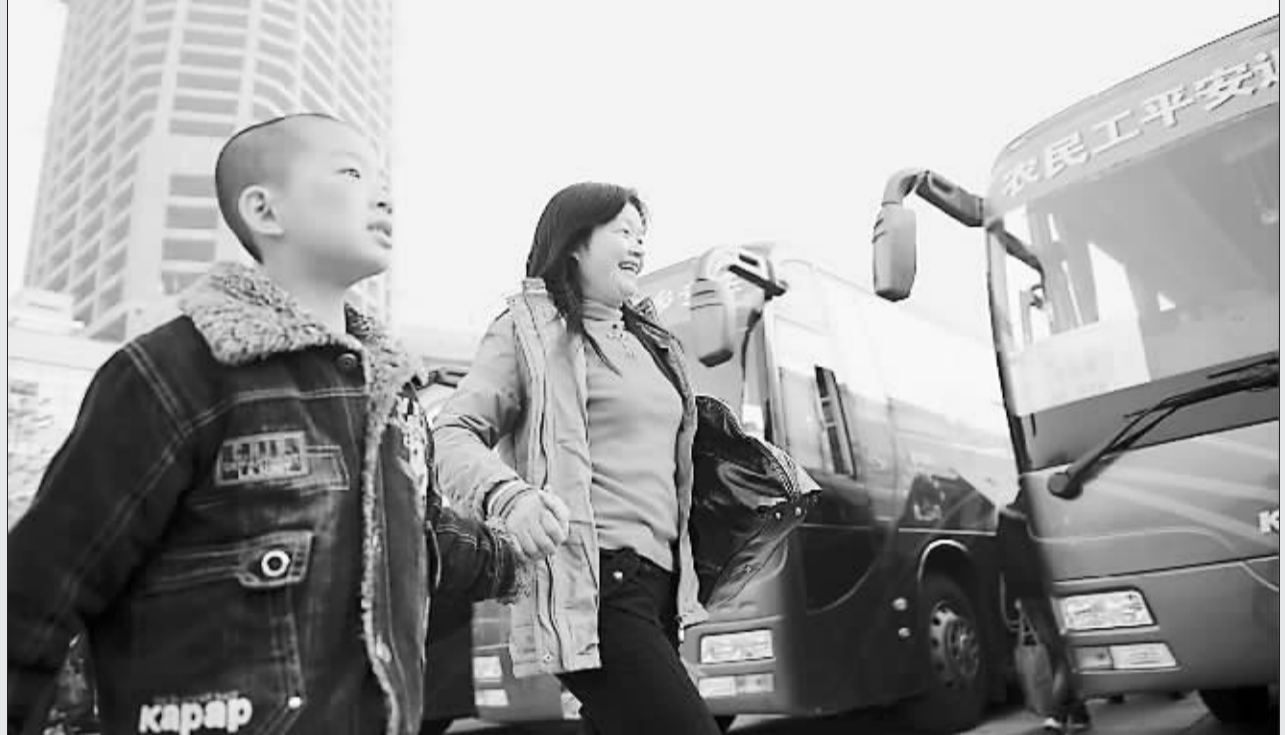
1月21日上午,农民工牵着孩子提着行李开心地上车。当日,在厦门市工人文化宫广场前,11辆大巴车满载近500名来厦务工人员,从厦门开往福建龙岩、长汀、上杭、连城和永定等地,免费送他们返乡过年。