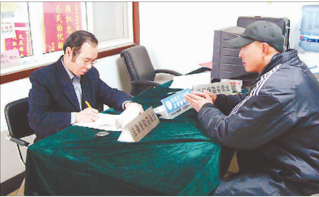
1月14日,北京市西城区法律援助中心的值班律师在接待来访群众。 左图:值班律师在接待投诉者。 右图:劳动仲裁裁决小娟败诉的判决书。