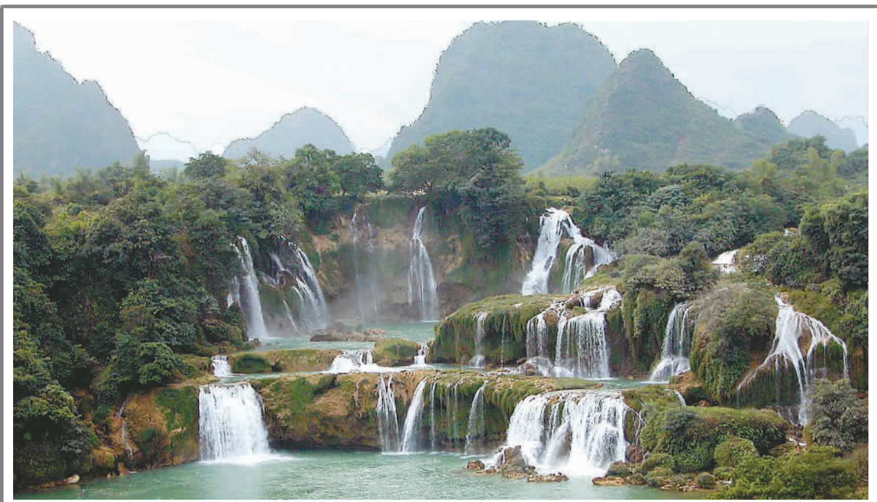
德天瀑布山水画廊

去年12月底,我和同事去印度加尔各答考察。12月31日下午,在我们开会学习印度税收政策的间隙,印度厂长经理激动地说明天就是新年了,他们要放假一天,今天晚上想邀请中国客人和他们一起共迎新年,希望大家都要赴约,最好打扮得帅一点。最后这句把我们逗乐了。 话音刚落,就见几个服务员鱼贯而入,把邀请函立刻发到每一位与会人士手上。邀请函简短却很正式,详细注明了聚会的时间和地点。 晚上我们被带到了市中心一家酒店,空旷的大厅富丽堂皇,彰显着浓浓的印度特色。 印度经理站在大厅中央满面春风地说,今天很荣幸能和中国朋友一起共迎新年,希望你们在这里玩得开心,不要想家,大家随意。 我的心不由得凉了半截,这怎么和平日印度人请客一个样子啊。我极力掩饰自己的不开心,也像其他朋友一样,要了杯威士忌和朋友们无精打采地闲聊起来。因为我的心情不佳,聊了一会儿,我便独自要了盘印度炒饭就威士忌在角落里喝起了闷酒。 让我感到奇怪的是,今天宴会没有要停下来的意思,这和平时印度人请客不一样,他们一般请客时间很短。 不知过了多长时间,我还依旧在独自苦饮时,印度经理走到我的跟前,碰了下我的杯,小伙子想家了吗,我笑了笑未置可否。他笑着说等着看吧,好戏还在后头呢。什么好戏,我一下子来了精神。 23点左右,大厅里突然响起了轻柔的印度古典音乐,身边的印度女士甚至和着音乐跳起了舞。两名服务生推着一个桌子缓缓步入大厅,桌子是酒席上常用的大桌,而桌子上摆放一个和桌面几乎一般大小的巨大蛋糕,蛋糕上插满了密密麻麻的闪着火苗的蜡烛,蛋糕一边点缀着Welcome2009的字样。 大厅里的印度人激动起来,有的吹起了口哨,有的跳起了舞,有的唱起歌,跳起了舞。我也被印度人为年过生日的创意感染了,跟着他们大喊大叫。 突然灯灭了,全场印度人高声喊着5-4-3-2-1,这时新年的钟声从不远处教堂传来,声音浑厚,直击人的心门。围在桌子四周的十几人一起使劲,才吹灭了蜡烛。 蜡烛刚灭灯便亮了,印度人又是一阵欢呼——“快看,外边的烟花真漂亮!”五彩的烟花把夜空装扮得绚丽多彩。印度经理又发话了:“女士们,先生们,朋友们,一起狂欢吧,今晚是属于你们的。”那些平日保守的印度女士们也像变了一个人,热情地邀请我们跳舞,唱歌,喝酒。 印度新年,我度过了一个不眠之夜。