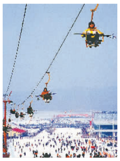
北国沈阳寒冷但不冷清,这里的辛勤智慧的人们,用冰、用雪,创造了一个多姿多彩的世界,在这个世界上,欢乐是永恒的主题。

突出“天下第一牛”的宏伟气势。 其实,沈阳虽是北国,也不经常是“万里雪飘”。一个冬天只下几场不大不小的雪是常事。那么,雪雕用的雪从哪儿来?人造的。记者在“冰雪大世界”采访时看到,10多台造雪机械“雪地机”正在紧张地工作着,空场上已经堆起小山似的雪。 看景之外,那就是滑雪。“冰雪大世界”、“东北亚滑雪场”既有适合具备一定专业水平的滑雪高手一展身手的雪道,更多的是适合“来玩儿”的大众滑雪道。 看滑雪高手滑雪,那是一种精神享受。身轻似燕,从高处飞驰而下,滑到头时,一个姿势优美的转身,真是帅呆了!至于那些“来玩儿”的,则是又一番景致——一个接一个摔跟头,摔的人笑,看的人笑。“来玩儿”的人是绝大多数,整个滑雪场真是处处欢声笑语。