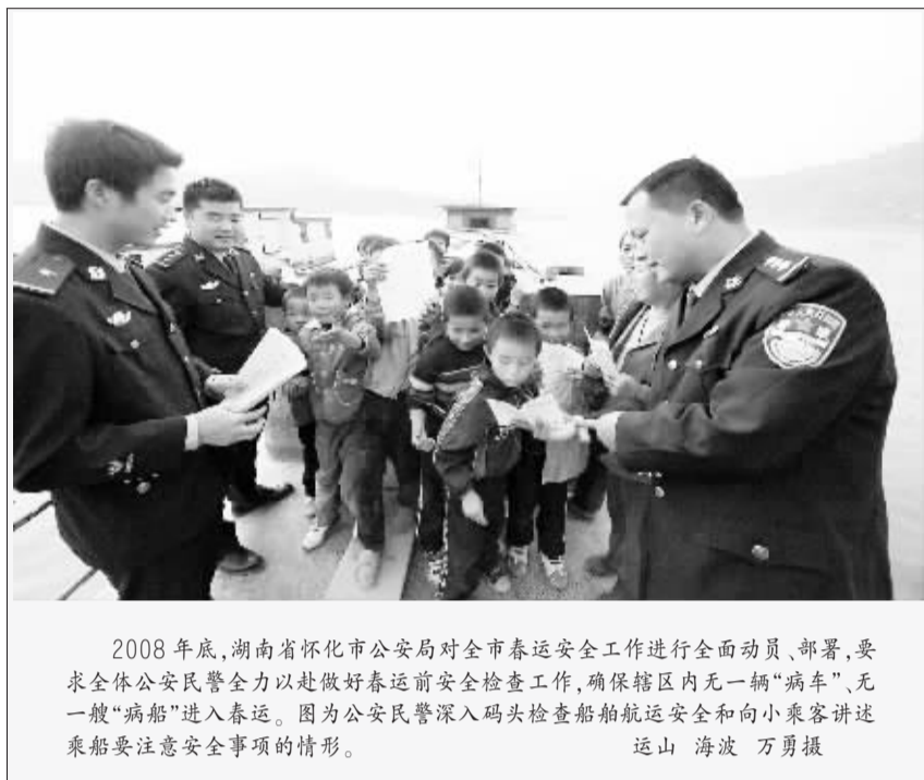
2008年底,湖南省怀化市公安局对全市春运安全工作进行全面启动、部署,要求全体公安民警全力以赴做好春运前安全检查工作,确保辖区内无一辆“病车”、无一艘“病船”进入春运。图为公安民警深入码头检查船舶航运安全和向小乘客讲述乘船要注意安全事项的情形。

该院建立“检察服务热线”,积极参与矛盾纠纷排查调处工作,依法妥善解决群众的合理诉求,最大限度增加和谐因素,最大限度减少不和谐因素,努力化解群众矛盾纠纷。2008年,该院共办理群众来信来访的控告申诉、举报案件58件,从举报件中立案查处职务犯罪案件11件,移送其他机关处理8件,群众满意率达95.2%。