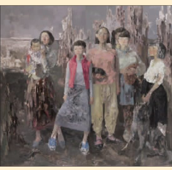
笨鸟之三 (油画) 张延昭