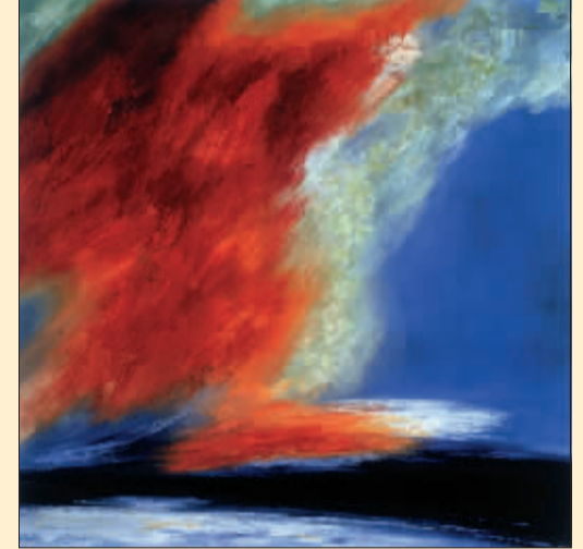
祥风 (油画) 吕中元