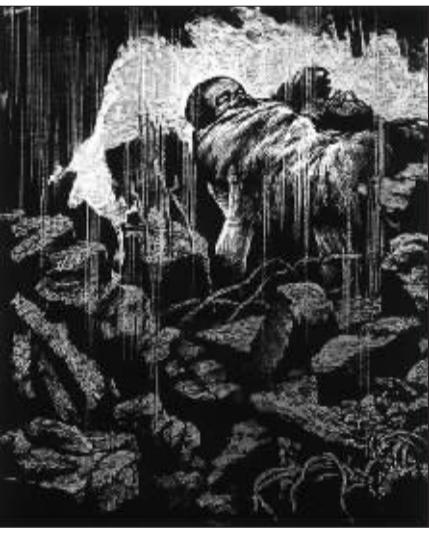
决不放弃 (版画) 史一