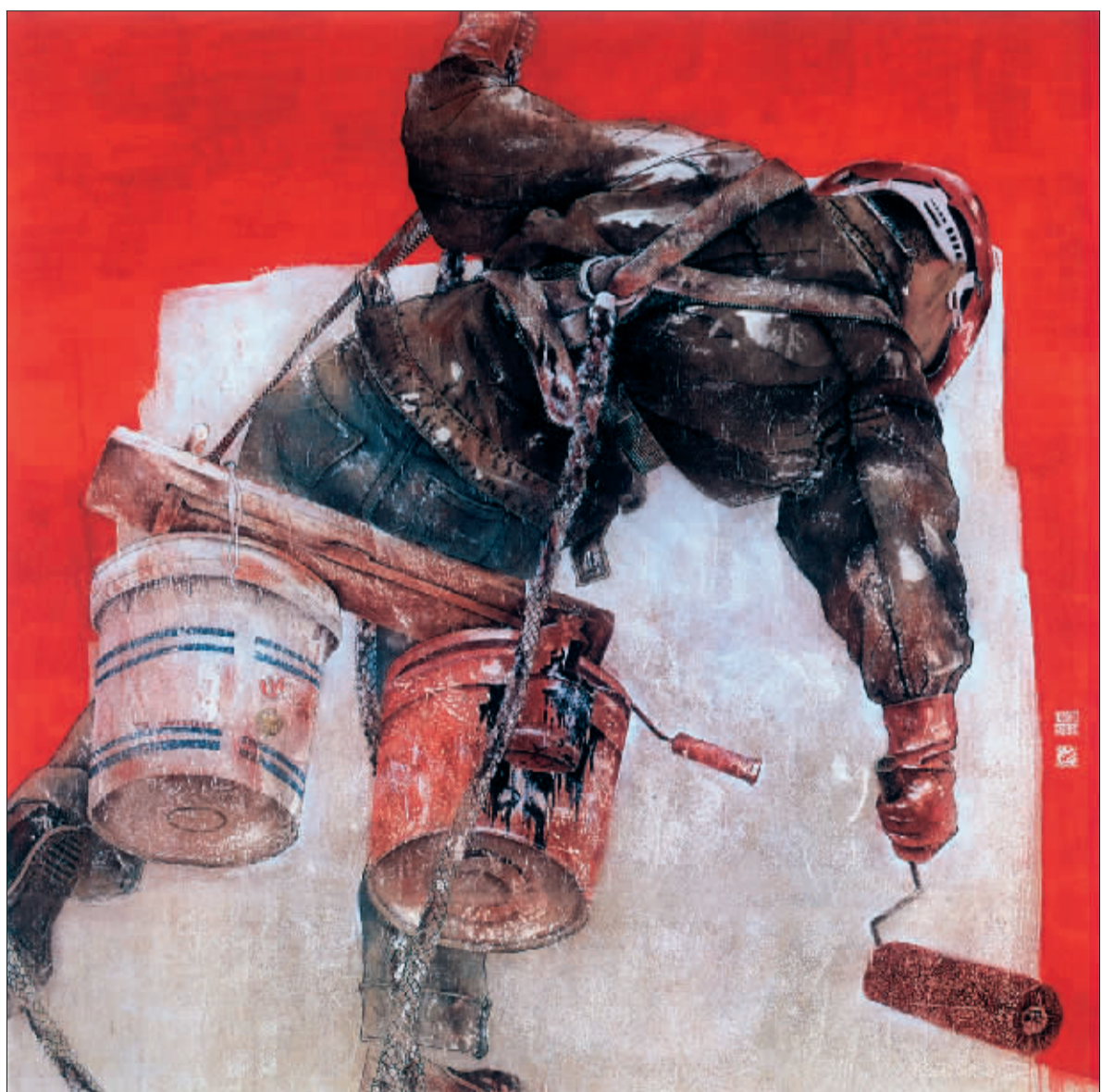
中国红 (国画) 田野

革开放30周年——全国美术作品展览”于2008年12月26日至2009年1月2日在北京中国美术馆举办。展览以歌颂改革开放为主题,深情描绘30年的明媚春光和峥嵘岁月。参展作品既有描绘大好河山的壮丽、新农村绚丽风光、现代化建设的大主题;也有“小桥流水”的婉约乡情;既表现伟人高瞻远瞩的气魄,也表现普通劳动者的“螺丝钉”精神。丰富多彩,反映了改革开放30年中国社会发生的深刻变化,为和谐时代献上一曲深情的颂歌,为民族的伟大复兴留下历史的印记。