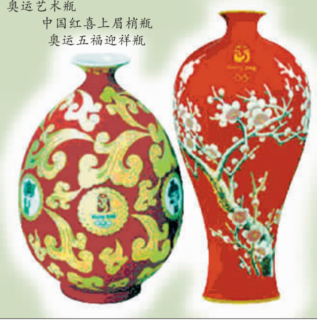
奥运艺术瓷 中国红喜上眉梢瓶 奥运五福迎祥瓶

金等经典陶瓷工艺融为一体,经60多道工序纯手工烧制而成。“奥运艺术瓷·中国红”工艺之繁、技术之难、耗资之甚、艺术之精,成品率不到10%。一点不亚于古代的“御用瓷器”,堪称一代美器、艺术瑰宝。