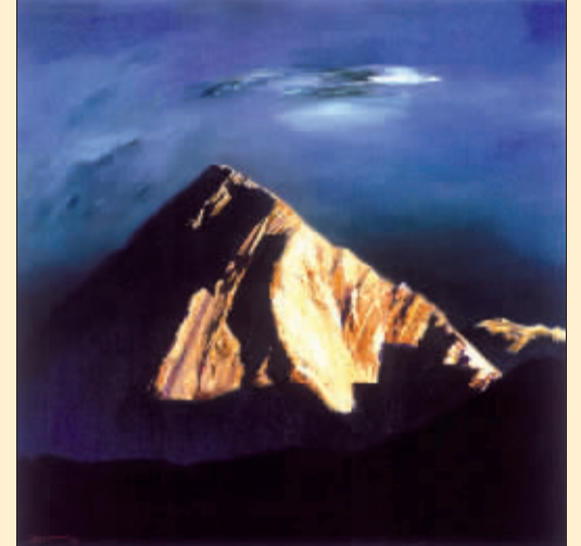
禅影 (油画) 吕中元