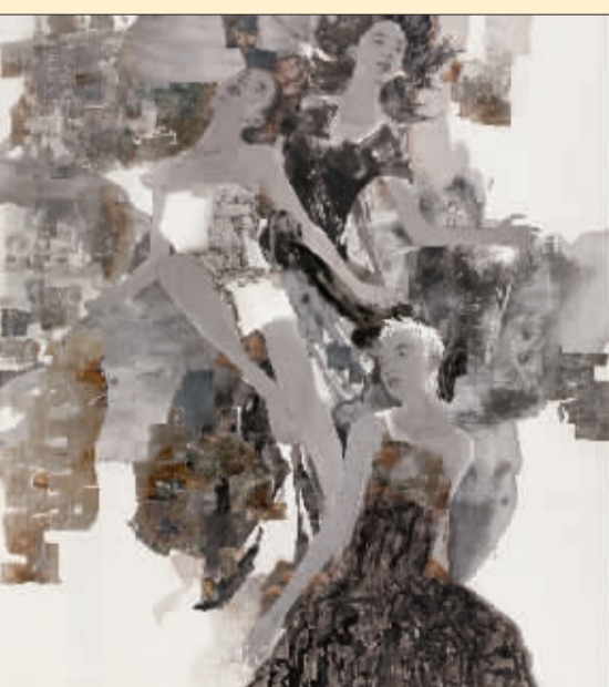
青春 (国画) 姜浩宇