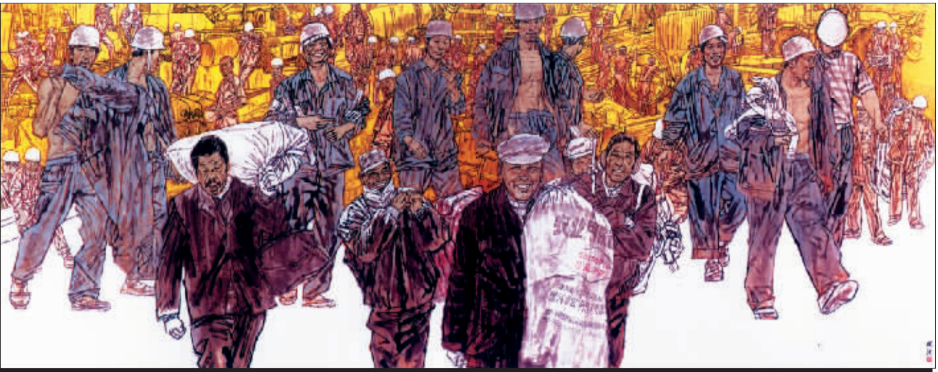
建设者 (国画) 马国强