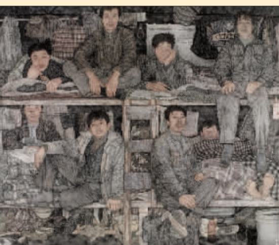
工棚 (国画) 李传真