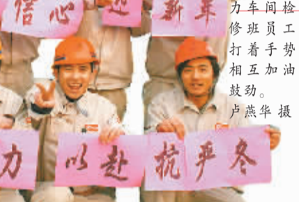
山东莱钢集团动力部水车车间检修班员工打着声势相互加油鼓劲。

这冲动来自那一年一度的别迎感叹。人生短暂,几十年的光阴如过眼云烟。然而,就在这一个瞬间,我们却尝了人生中的酸甜苦辣五味;闻了人间的官商角徵羽五音;目了大千世界的青黄赤白黑五色。虽说人与人之间苦甜不一,高低有别,色泽各异,但只要自己心情愉快,坦然自若,其它又何必在意? 有人觉得金钱地位重要,亭台楼阁华丽,披金戴玉尊贵。然而,更多人却依然相信贫寒出孝子,茅屋养贤能,布衣生智慧!我拥我所有,我享我追求。心胸坦荡、心情豁然、身心健康、一生平安的人生是美好的。 新年将到,我们的心情需要新调整,精神需要新振奋,士气需要新鼓舞,就让我们以新姿态、新精神、新风貌、新工作态度,去重新播种、耕耘、收获吧!