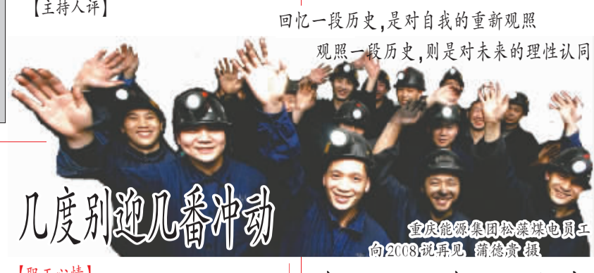
重庆能源集团松藻煤电员工向2008说再见,向2009说你好。

近日,中铁路三局电务公司唐曹高速公路机电班荣获了由中国质量协会、中华全国总工会、共青团中央、中国科学技术协会和中华全国妇女联合会联合评选的“全国质量信得过班组”称号。 该班承担的唐山曹妃甸高速公路机电通信、收费、监控三大系统工程,具有技术新、质量标准高、施工难度大等特点。每道工序、每个施工环节都坚持自检、互检、交叉检查的制度,被业主称为最放心、最实在的施工队伍。 (孙清华、王祥山)