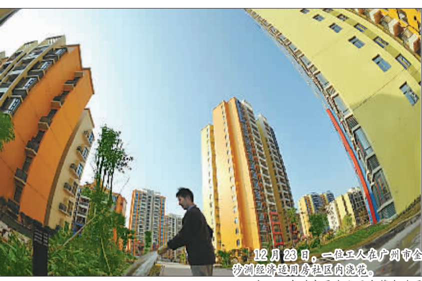
12月23日,一位工人在广州市金沙洲经济适用房社区内浇花。

还有市民表示,当前商品房价格正走低,如果经济适用房的价格偏高,甚至接近商品房的水平那就不值了。据统计,这次广州推出的经济适用房建筑面积在70平方米以上的房屋有1251套,占总量的58.3%。金沙洲、聚德花园和泽德花园是2006年开工建设的新社区项目,部分住宅的供应对象为被拆迁家庭,对这部分家庭的供房面积略大于经济适用房控制面积。广州市社科院科研处处长彭澎认为,经济形势不好让困难家庭的购房行为变得更加保守。困难家庭会面临下岗和减薪的压力,许多家庭会推迟购房计划。彭澎建议,广州应该在房地产市场低迷的情况下减少经济适用房的建设量,同时要降低经济适用房的档次,减少建房成本。