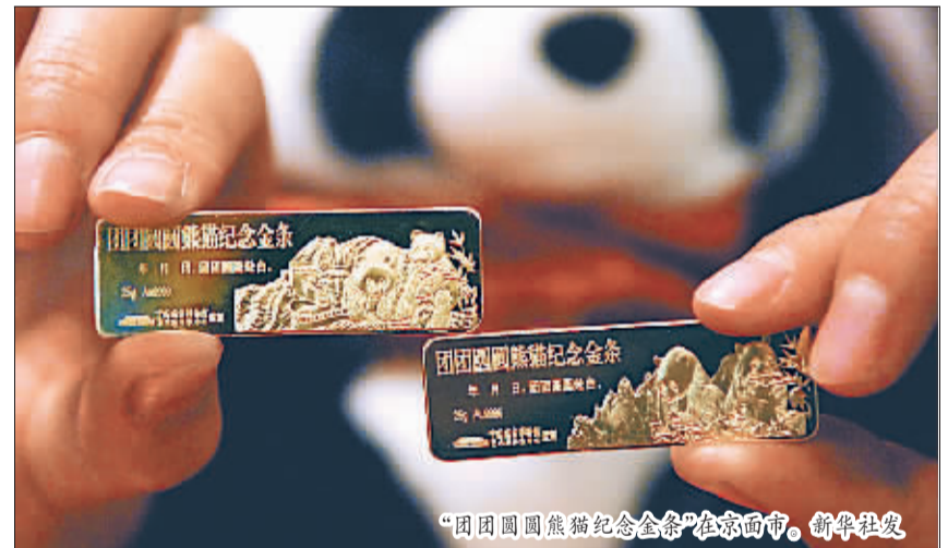
“团团圆圆熊猫纪念金币”在京面市。

本报讯(记者刘静)12月21日晚上9时39分,我国第一列卧铺动车组D301次从北京站首发前往上海,它的开行将彻底改变中国铁路没有卧铺动车组的历史,并开启铁路在动车组上推出“服务超越航空”的服务提升计划。记者获悉,第一列卧铺动车组百余张软座售罄,卧铺售出八成。