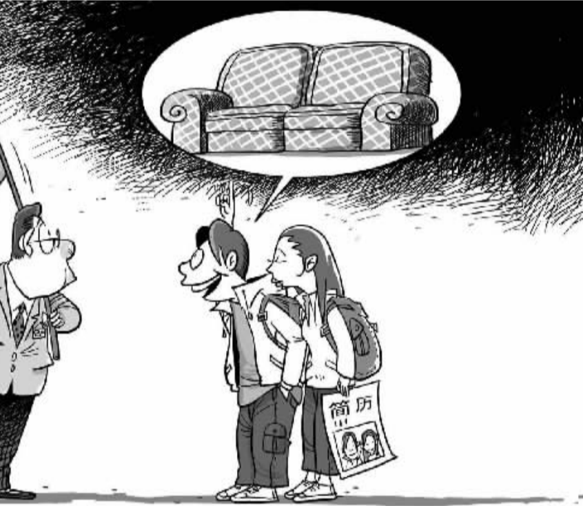
大学毕业生一开始要找的只是一个工作,而不是职业,更未必是事业 【漫画】赵春青