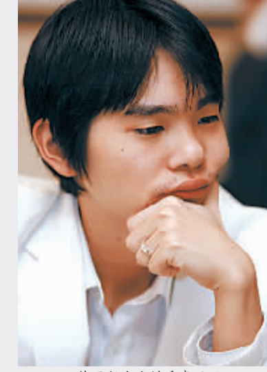
韩国新生代棋手李世石

12月15日,第13届三星杯世界围棋公开赛三番棋半决赛在韩国釜山进行。结果在四强中占据了三个席位的中国军团并未迎来期待中的“完胜”,四强中唯一的一名外国棋手用胜利给中国棋手提前包揽冠军的梦想浇了一盆“冷水”。这位外国棋手,就是韩国新“天王”李世石。 虽然本届三星杯的半决赛还有两个回合,但无论从历史战绩还是目前状态来看,此番与李世石对抗的中国棋手黄奕中都很难担当起阻击“石头”(韩国媒体给李世石的新称号)的重任。回顾近年来的国际比赛,常昊、古力、孔杰、周鹤洋、俞斌等中国围棋的一流好手,均在与李世石的对抗中处于下风。李世石,在逐步巩固韩国国内棋坛统治地位的同时,也在渐渐蚕食国际棋坛“领地”,已经逐渐取代李昌镐,成为韩国围棋新的“旗手”。 面对这块才生成了25年(李世石年仅25岁)的他山之“石”,中国棋手在整体上还缺乏“攻克”的有效手段。如果中国棋手不能跨越这座挡在中国棋手争夺世界冠军过程中的“大石头”,说中国围棋强大就缺乏足够的底气……中国围棋协会主席王汝南曾如此评价李世石:“以李世石的实力和年龄,未来几年都将是与中国棋手最主要的竞争对手。”