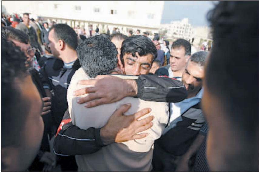
12月15日,在约旦河西岸城市拉姆安拉,获释的巴勒斯坦人与亲人拥抱。以方当天释放了224名在押的巴勒斯坦人。目前,仍有约1万名巴勒斯坦人被关押在以色列监狱中。

据新华社阿尔及尔12月15日电(记者尹 邦斌)石油输出国组织(欧佩克)轮值主席、阿尔及利亚能源和矿业部长沙基卜·哈利勒15日在阿西北部城市奥兰向新闻界发表讲话时表示,欧佩克成员国的能源部长一致同意削减原油产量。欧佩克秘书长巴德里15日在奥兰回答记者提问时也表示,目前国际市场上原油供应过剩,因此欧佩克将大幅度减少产量。