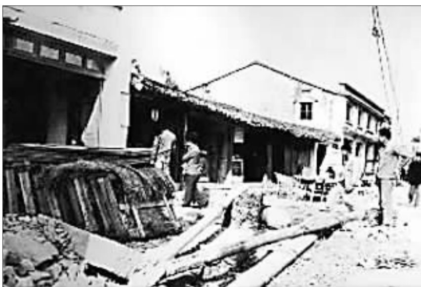
24年前的温州龙港。1984年，一场当时被视作“触犯天条”的实地运动，使其成为“中国第一座农民城”，大量的民营资本开始涌入。

1989年6月，国家对电冰箱开始实行定点生产，民营背景的北板花电冰箱厂自然没有列入定点生产企业的名单。没有“准生证”，就意味着李书福的冰箱厂必须关门。这一年的经历对于当时只有26岁的李