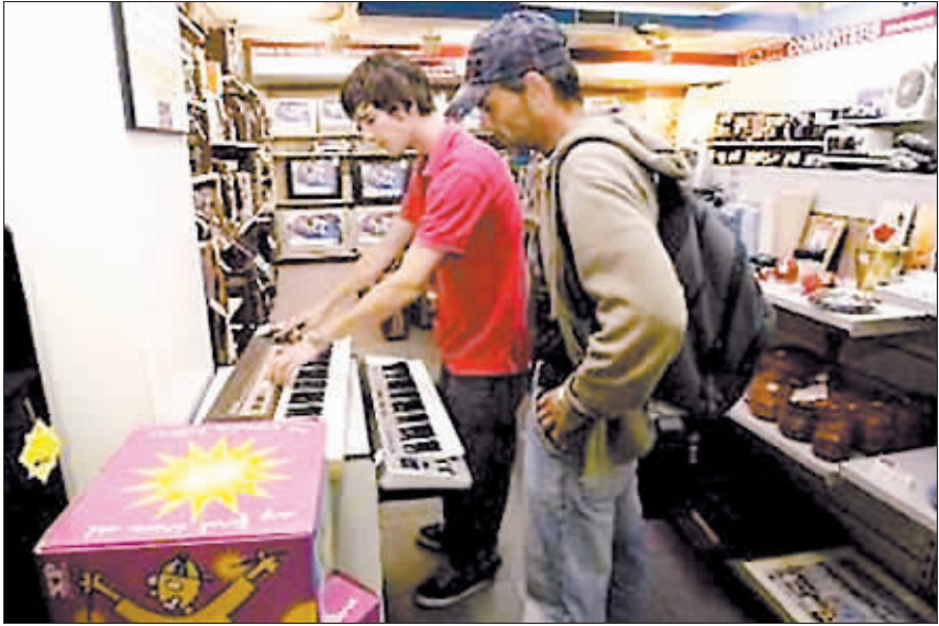
由于金融危机席卷全球，欧洲的消费者变得越来越节俭，减价商店和二手货商店也变得顾客盈门。图为12月9日在西班牙首都马德里一家二手货商店里，店员正向顾客介绍商品。

挽救欧盟实体经济是本次峰会议程的重中之重。受国际金融危机冲击，本已长期低迷的欧元区经济在今年第二、第三两个季度连续出现0.2%的环比负增长，从而出人意料地先于美国陷入衰退。同时，欧盟整体经济也已走到衰退边缘。