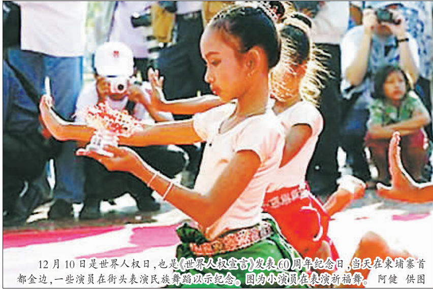
12月10日是世界人权日，也是《世界人权宣言》发表60周年纪念日，当天在柬埔寨首都金边，一些演员在街头表演民族舞蹈以示纪念。图为小演员们在表演新编舞。

针对大幅走低的支持率，麻生8日表示将通过提出果断的政策措施改善经济状况，给国民一个交代。但政策是否如其所言，日本政坛近期又将发生怎样变化，还有待观察。