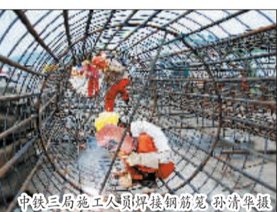
京沪高铁上的900吨巨型箱梁