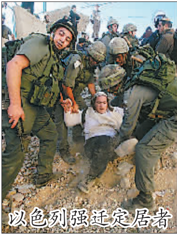
以色列强迁定居者

据报道，当地时间10时40分，警察在对那拉提瓦府乍奈县的一家商店进行检查时，武装分子引爆了炸弹。