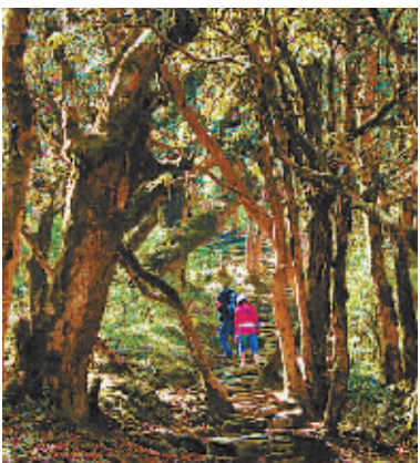
在千年老杜鵑林里穿行