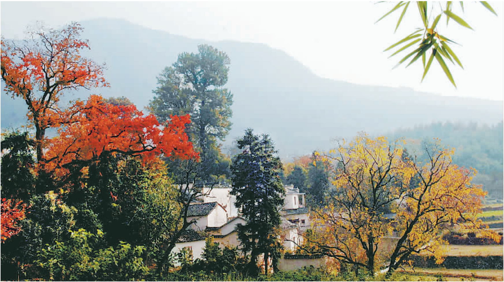
安徽省黟县塔川村,是世界文化遗产地。这片宁静而美丽的小村庄,与北京香山、九寨沟齐名。