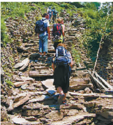
行走在徒步线的游客