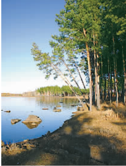
美丽的五大连池遭遇污染萎缩成坑

2007年10月,郧县国家地质公园一期工程重点建设项目——郧阳地质博物馆动工。该博物馆总投资3000万元,建筑面积为2580平方米,高度15米,共两层,其中一层为恐龙厅、演示厅、景观厅,二层为展示厅、地质厅及办公室。