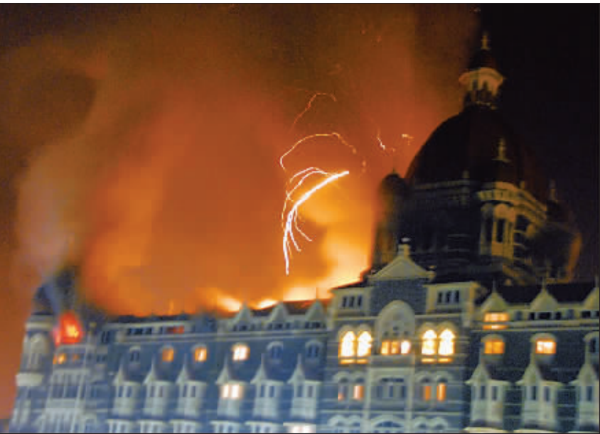
11月27日,印度孟买的泰姬玛哈酒店遭恐怖袭击后发生火灾。