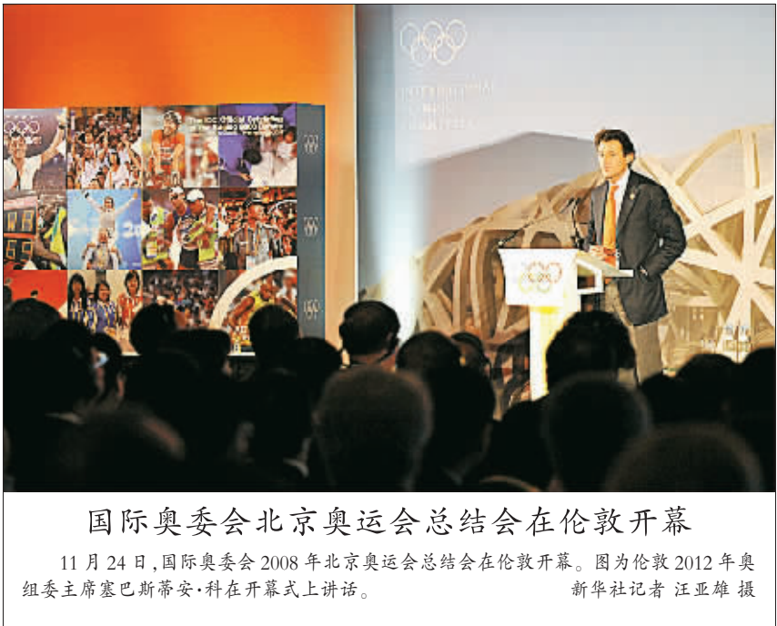
国际奥委会北京奥运会总结会在伦敦开幕。图为伦敦2012年奥组委主席塞巴斯蒂安·科在开幕式上讲话。

罗格表示：“奥运会没有‘最好’或‘最伟大’，只有‘不同’。每届奥运会都是独特的。奥运会的好坏不是花多少钱就能决定的，还要看主办城市是否有独特和激动人心的氛围。我相信伦敦在这方面能做得很好。”总预算高达90亿英镑的伦敦奥运会正面临资金不足的窘境。蔓延世界各地的金融危机令伦敦奥运会两个主要基建工程(预算10亿英镑的奥运村和4亿英镑的媒体中心)开发商资金无法到位。为了节省开支，伦敦已经取消了4项临时场馆的修建计划，而把赛事转移到现有场馆内进行。罗格表示自己清楚伦敦面临的资金问题，但仍对伦敦有信心。他说：“我知道我们在北京的成功之后，步入了经济困难时期。但奥运会以前也曾成功渡过难关。奥运会的历史告诉我们，只要下定决心和努力奋斗，就能战胜暂时的困难。”罗格还说，伦敦奥运会和2010年温哥华冬奥会曾首次遵循奥运会研究委员会在2003年提出的标准，对奥运会的规模和开支加以限制。他说：“伦敦已经学到了这一点，将在奥运遗产和可持续性上做文章。伦敦奥运会将使用现有和临时场馆，利用城市已有的基础设施建设。只有那些奥运会后仍能被社区长期使用 的设施，才会考虑新建。温哥华和索契(2014年冬奥会主办城市)也明白这一点。”