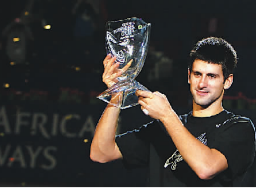
德约科维奇首捧网球大师杯

11月16日,塞尔维亚选手德约科维奇在颁奖仪式上举起奖杯。当日,2008上海网球大师杯赛在上海旗忠森林网球中心落下帷幕。在男子单打决赛中,塞尔维亚选手德约科维奇以2比0战胜俄罗斯选手达维登科,首次捧起大师杯赛奖杯。