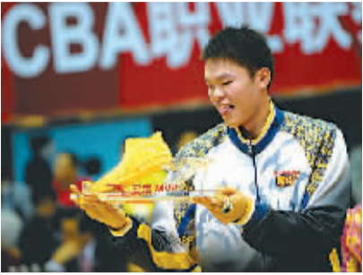
11月16日,朱芳雨作为上赛季最有价值球员获得金靴。

的荣誉奖杯——MVP奖杯和最佳教练奖杯。据了解,2004-2005赛季,戴梦得公司第一次为CBA联赛打造“中国篮球至尊钻戒”,广东队力压群雄,新获当年的联赛总冠军,成为CBA历史上第一支戴上总冠军钻戒的球队。(刘君)