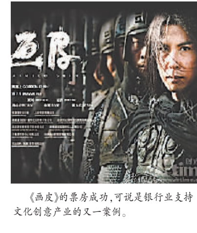
《画皮》的票房成功,可说是银行业支持文化创意产业的又一案例。